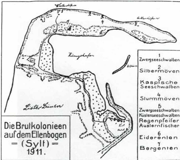
Abb. 4: Die Brutkolonien der Raubseeschwalbe ( Hydroprogne caspia ) lagen in der Mitte zwischen dem westlichen und östlichen Leuchtturm auf dem Ellenbogen (aus: Die Heimat, 22. Jg., 1912).

Schwarzspecht ( Dryocopus martius ), Tannenhäher ( Nucifraga caryocatactes ), Neuntöter ( Lanius collurio ), Raufußbussard ( Buteo lagopus ), Mäusebussard ( Buteo buteo ), Rohrweihe ( Circus aeruginosus ), Bluthänfling ( Acanthis cannabina ), Ringeltaube ( Columba palumbus ) sowie Löffelente ( Anas clypeata ), Stockente ( Anas platyrhynchos ), Krickente ( Anas crecca ) und Pfeifente ( Anas penelope ). Heute sind überall auf der Insel günstige Vogelbeobachtungen möglich. Eine besondere Rolle spielt die Ostseite der Insel, wo täglich zweimal große Flächen von Schlick-, Sand- und Mischwatt überspült und wieder freigelegt werden. Während des Vogelzugs im Frühjahr und Herbst ist das Wattenmeer eine der vogelreichsten Landschaften Mitteleuropas. Der Nahrungsreichtum bietet hier insbesondere Wat- und Wasservögeln beste Lebensbedingungen. HAGENDEFELDT hat den Zugverlauf in mehreren Aufsätzen geschildert (HAGENDEFELDT 1907c, 1909b, 1910a, 1911a, 1911b, 1912). Vermutlich hat er dafür vielfältige Anregungen von HEINRICH GÄTKE (1814-1897) erhalten.