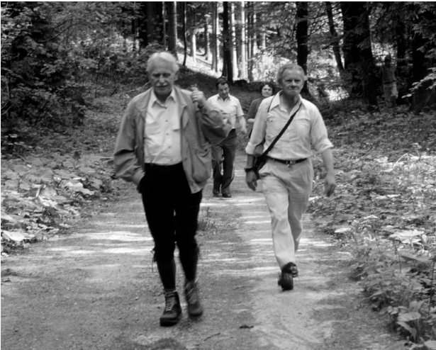
Abbildung 3: Exkursion mit den Freunden der Bayerischen Staatssammlung für Paläontologie, Kremberg bei Neukirchen, Mai 1992

Höhepunkt war seine Ausrichtung und Koordination des 17. Mikropaläontologischen Kolloquiums 1981 in Oberbayern. In Vorträgen, auf Exkursionen und vor allem in Publikationen des Tagungsbandes [74] konnte das Geleistete vorgeführt und dargestellt werden.