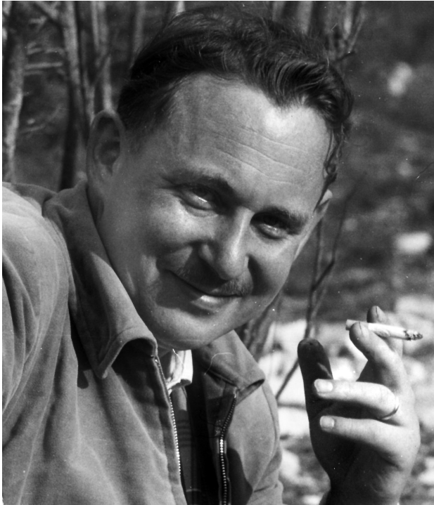
Abbildung 1: Führung der Exkursion C der Jahrestagung der Paläontologischen Gesellschaft, Rohrdorf bei Rosenheim, September 1960.

Die Arbeiten wurden regional ausgedehnt, wenn es um die Entstehung der Alpen in der Kreide, vor allem aber ums Tertiär ging - nach Süden in der Habilitationsschrift [32] 1955