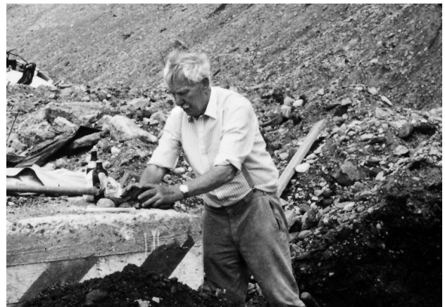
Abbildung 6: Bergung von Scherben im Bauaushub; hier in Rosenheim, Frühjahr 1988.

Die systematische Materialbergung 1987 und 1988 und bis 1991, jeweils schichtweise am Pfisterbach [171, 193], Alte Münze und vor allem am Marienhof [140, 147, 153, 165] brachten Daten zur mittelalterlichen Marktgeschichte, aber mit den wertvollen Funden von Fayencen, Gläsern und Spielzeug auch Hinweise auf einen Wohlstand um 1600 [158]. Reichere und ärmere Viertel lassen sich aus den Haushaltsresten in den aufgefüllten Brunnenschächten gut rekonstruieren, sie sind ein Archiv für die Stadtkernentwicklung [108, 126, 140, 159]. Großen Wert legte HAGN auf die Ausstellung der Funde und zwar in ihrem geschichtlichen Funktionszusammenhang. So sollten die zahlreichen, oft sehr mühsam restaurierten Objekte eine Geschichte erzählen über das wechselvolle Leben in den Städten. Solche Ausstellungen gab es in der Prähistorischen Staatssammlung, in der Burg Grünwald 1990 oder in Moosburg 1990 mit den Schlüsselfunden für ganz Bayern [131]. HAGN