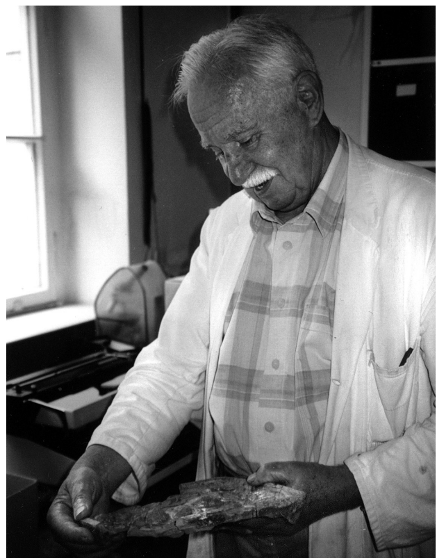
Abbildung 4: Stets voller Freude an großen Fossil-Fundstücken, 1998.

Ein wichtiger Impuls aus dieser Zeit sind die Kunstkeramik-Funde aus Gschaid bei Peterskirchen [85] aus einer Bruchgrube, die genau datiert werden konnten. Die künstlerischen Motive gaben Hinweise auf die kunstgeschichtliche