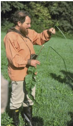
Carex-Demonstration im Sundgau, 1990