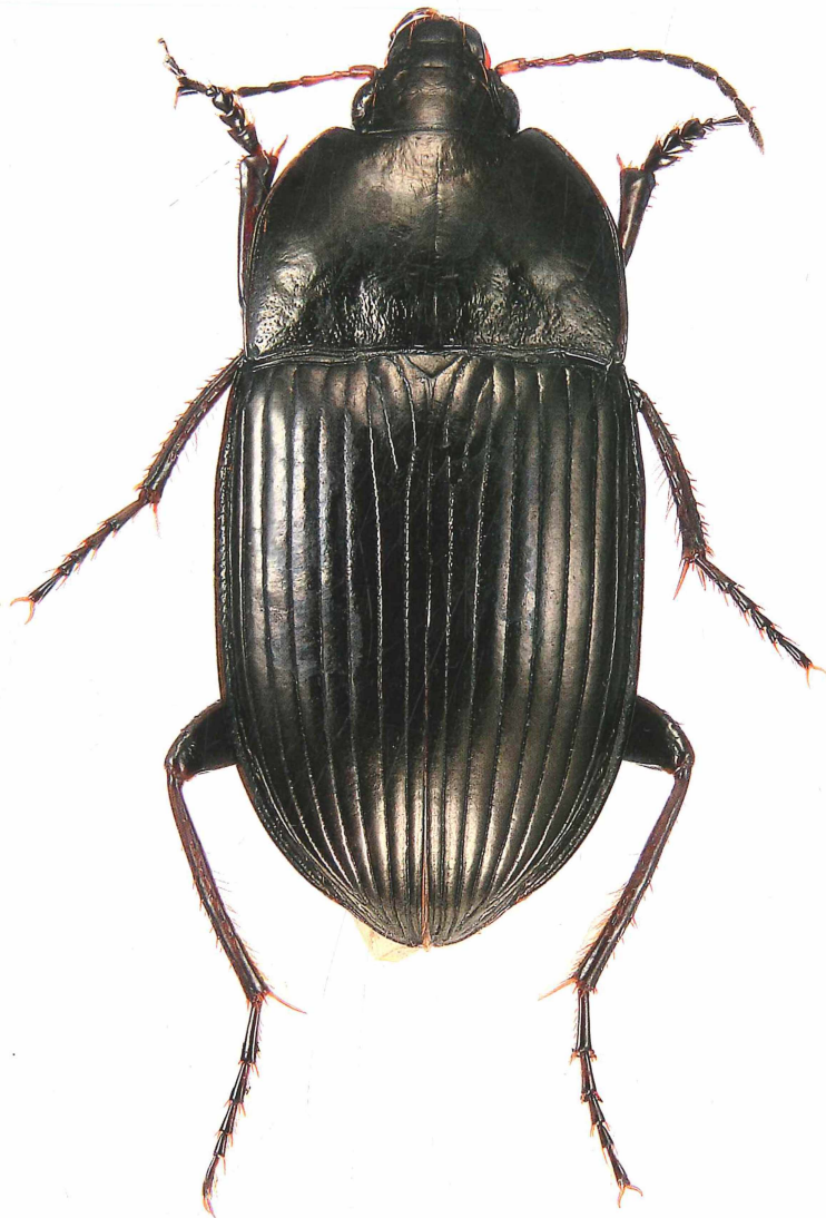
Abb. 2. Amara macrovata HIEKE, 2009: Paratypus aus China: N Henan, Jiuligou.