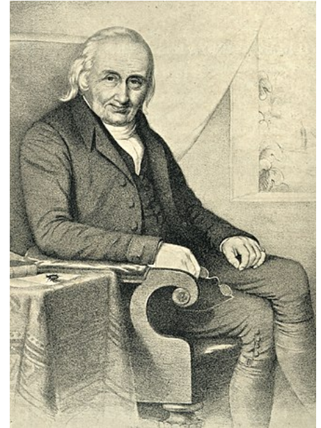
Reverend William Kirby (Lithografie von T. H. Maguire, 1851)

Kirby veröffentlichte auch die theologischen Schriften Strictures on Sir James Smith’s Hypothesis