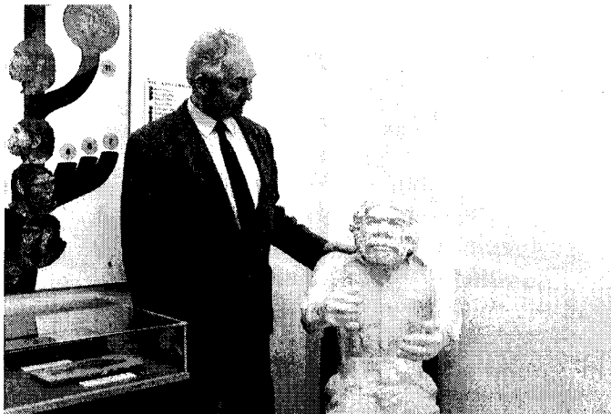
Ausstellungseröffnung im Fuhlrott-Museum mit Neanderthaler im März 1996.