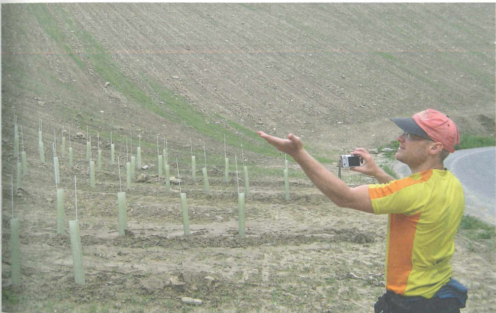
Abb. 4 | „... und wieder eine Trockenwiese weniger ... deshalb trinke ich auch keinen steirischen Wein mehr!“ | Foto: HKBS

Lindengasse 4e | A-8501 Lieboch | mailto: hkbs@aon.at