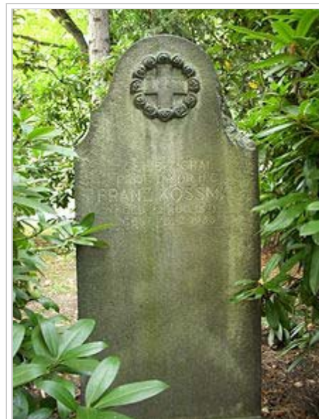
Grabstätte Franz Kossmat auf dem Südfriedhof in Leipzig