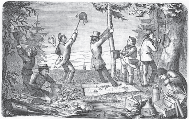
Abb. 7: „Kerfjagddarstellung“ aus GRABER (1877, Fig. 1).

Aus seinen Aufnahmen wurden damals schon erste und durchaus richtige Vorstellungen über die Stellung der Flügel im Raum gewonnen (NACHTIGALL 2003). Lendenfeld war auch als Geograph und Alpinist bedeutend (JANETSCHKE 1969, siehe LENDENFELD 1899). Viele seiner Expeditionen erfolgten zusammen mit seiner Frau Anna (WOLKENHAUER 1914, HÖSCH 1972). Die ersten Befunde zu Gletscherschliffen in Australien sowie die Vermessung des höchsten Berges des Kontinents, des heutigen Mt. Kosciuszko 2228 m üNN, den er Mt. Townsend nannte, gehen auf ihn zurück (zur erstaunlichen Namensverwechslung der höchsten Gipfel der Snowy Mountains siehe SANDEMAN 1991). Nach ihm ist der sechsthöchste Gipfel Neuseelands, der Mt. Lendenfeld (3194 m üNN), benannt. 1892 nahm er, nach dem Tod seines Vorgängers Vitus Graber, den Ruf nach Czernowitz an, 1897 den Ruf nach Prag, wo er auch als Rektor der Universität wirkte (1912-1913), sowie die Position des Direktors des Prager Zoologischen Institutes einnahm.