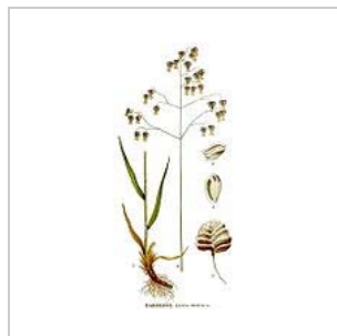
Gemeines Zittergras ( Briza media )