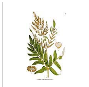
Königsfarn ( Osmunda regalis )