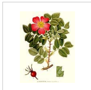
Apfel-Rose ( Rosa villosa )