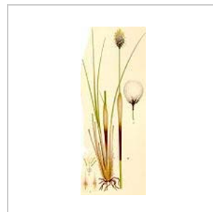
Scheiden-Wollgras ( Eriophorum vaginatum )