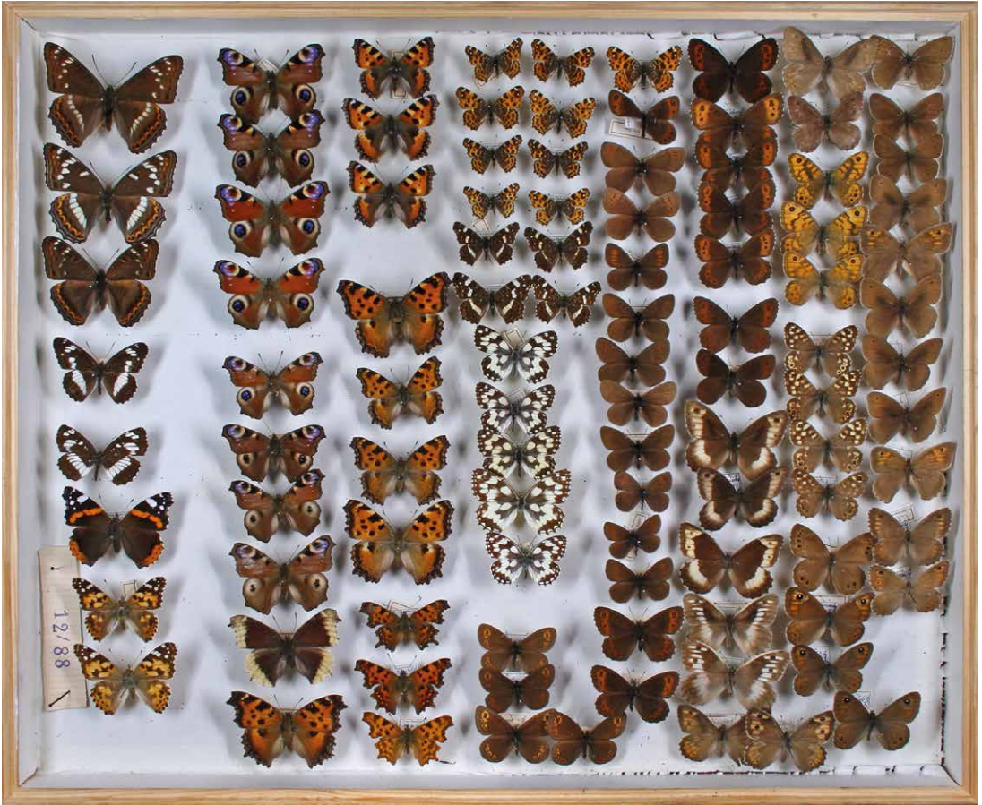
Abb. 1 Sammlung Lohr, Inv. Nr. I-0797-C, Foto: Katja Liedel, 2013.