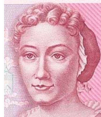
Porträt auf der 500-DM-Banknote

Gegen Ende des 20. Jahrhunderts wurden die Arbeiten von Maria Sibylla Merian auch öffentlich neu bewertet und gewürdigt. Ihr Porträt war ursprünglich für die 1990 neu eingeführten 100-DM-Scheine vorgesehen. Für das Porträt von Maria Sibylla Merian stand jedoch nur eine künstlerisch minderwertige Radierung von Johann Rudolf Schellenberg zur Verfügung, da an der ursprünglichen Vorlage Zweifel an der Authentizität aufkamen. Deshalb veranstaltete die Bundesbank einen Gestaltungswettbewerb, um eine qualitativ hochwertige Druckvorlage aus dieser Radierung zu bekommen, die später Grundlage für das Porträt auf dem Geldschein wurde. Da die 100-DM-Note als eine der ersten erscheinen sollte, wurden aufgrund dieser Schwierigkeiten die Personen getauscht und der 500-DM-Schein erhielt Merians Porträt. [21] Die Rückseite trug eine Abbildung Merians mit einem Löwenzahn, auf dem Raupe und Falter des Ginster-Streckfußes sitzen. Diese Gestaltung wurde bis zur Umstellung auf Eurobanknoten beibehalten.