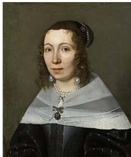
Jacob Marrel: Bildnis der Maria Sibylla Merian, 1679 (Kunstmuseum Basel)