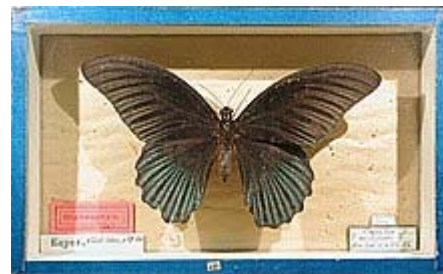
Ein Falter aus der Gerningschen Sammlung

Ihre künstlerische Arbeit fand bereits unter ihren Zeitgenossen Zustimmung. Während einer langen Zwischenzeit verschwanden die wenigen Bände der Erstausgabe schnell in Universitätsbibliotheken und bei einigen Gelehrten und Sammlern. Zwar versuchten mehrere Verleger, durch Nachdrucke der Metamorphosis die Popularität Maria Sibylla Merians kommerziell zu nutzen, diese Ausgaben erreichten aber nie mehr das hohe Niveau der von ihr selbst herausgegebenen Bücher. Erst im 20. Jahrhundert entwickelte sich wieder weit verbreitetes Interesse an ihren gezeichneten und kolorierten Blättern. Inzwischen war es möglich geworden, die Erstausgabe mit Hilfe hochentwickelter Reproduktions- und Druckverfahren originalgetreu wiederzugeben und in größeren Auflagen zu verbreiten.