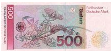
Rückseite der 500-DM-Banknote

Gegen Ende des 20. Jahrhunderts wurden die Arbeiten von Maria Sibylla Merian auch öffentlich neu bewertet und gewürdigt. Ihr Porträt war ursprünglich für die 1990 neu eingeführten 100-DM-Scheine vorgesehen. Für das Porträt von Maria Sibylla Merian stand jedoch nur eine künstlerisch minderwertige Radierung von Johann Rudolf Schellenberg zur Verfügung, da an der ursprünglichen Vorlage Zweifel an der Authentizität aufkamen. Deshalb veranstaltete die Bundesbank einen Gestaltungswettbewerb, um eine qualitativ hochwertige Druckvorlage aus dieser Radierung zu bekommen, die später Grundlage für das Porträt auf dem Geldschein wurde. Da die 100-DM-Note als eine der ersten erscheinen sollte, wurden aufgrund dieser Schwierigkeiten die Personen getauscht und der 500-DM-Schein erhielt Merians Porträt. [21] Die Rückseite trug eine Abbildung Merians mit einem Löwenzahn, auf dem Raupe und Falter des Ginster-Streckfußes sitzen. Diese Gestaltung wurde bis zur Umstellung auf Eurobanknoten beibehalten.