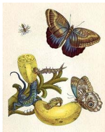
Seite XXIII aus Metamorphosis insectorum Surinamensium , Boccaves-Frucht mit Eidechse

„In Holland sah ich jedoch voller Verwunderung, was für schöne Tiere man aus Ost- und West-Indien kommen ließ, ... In jenen Sammlungen habe ich diese und zahllose andere Insekten gefunden, aber so, dass dort ihr Ursprung und ihre Fortpflanzung fehlten, das heißt, wie sie sich aus Raupen in Puppen und so weiter verwandeln. Das alles hat mich dazu angeregt, eine große und teure Reise zu unternehmen und nach Surinam zu fahren (ein heißes und feuchtes Land ...), um dort meine Beobachtungen fortzusetzen.“