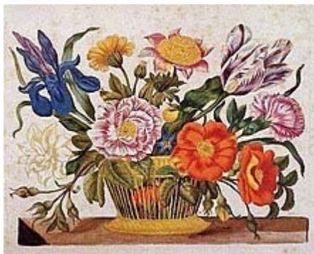
Kolorierter Kupferstich aus Das Neue Blumenbuch