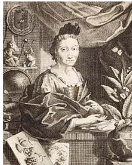
Portrait aus dem Jahr 1717. Stich von Jacobus Houbraken, nach Georg Gsell

Wegen ihrer genauen Beobachtungen und Darstellungen zur Metamorphose der Schmetterlinge gilt sie als wichtige Wegbereiterin der modernen Insektenkunde.