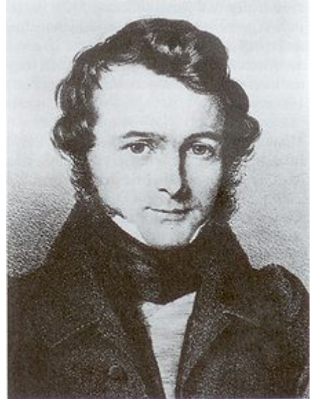
Hermann von Meyer (1801–1869)

Christian Erich Hermann von Meyer (* 3. September 1801 in Frankfurt am Main ; † 2. April 1869 ebenda) gilt als Begründer der Wirbeltierpaläontologie in Deutschland.