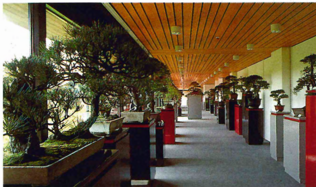
Die Sonderausstellung "Penjing" mit Miniaturbäumen aus China, aufgebaut in der Ruhezone des Museums