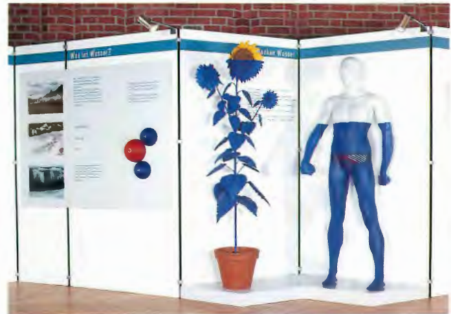
Die Sonderausstellung Trink?wasser; Aufnahme 1992