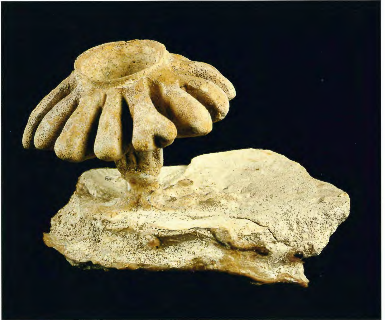
Fossiler Kieselschwamm (Coeloptychium lobatum) aus der westfälischen Kreide; Höhe: 5 cm