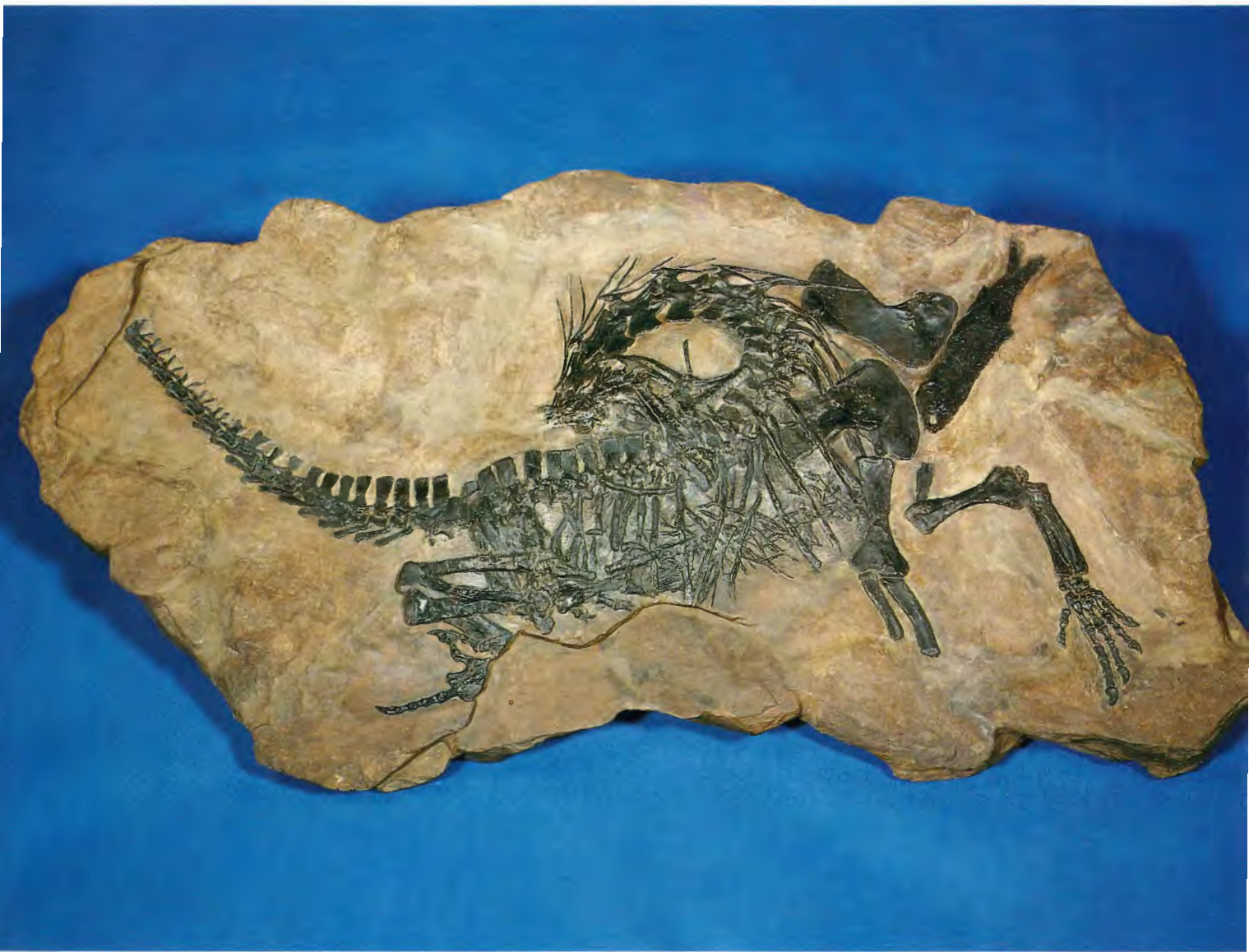
Restaurierter Saurier (Protosaurus speneri) aus dem Kupferschiefer von Ibbenbüren-Uffeln, Kreis Steinfurt