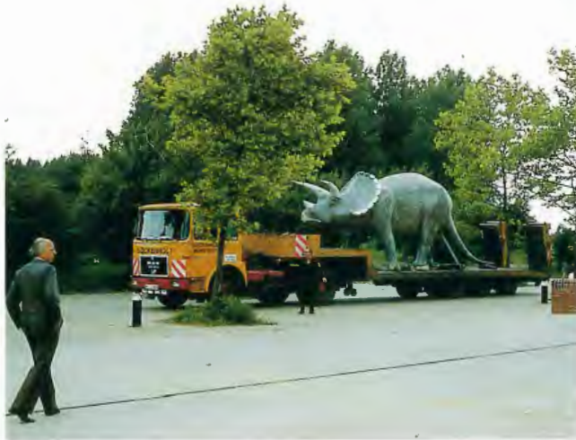
Der Triceratops wird angeliefert