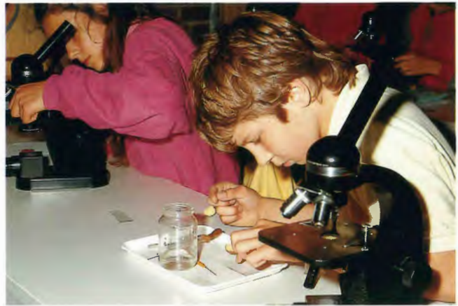
Schüler in der Museumsschule beim Mikroskopieren; Aufnahme 1987

Aufgrund des starken Besuches durch Gruppen mit Kindern oder Jugendlichen, vor allem Schulklassen, waren neben dem Angebot von Führungen und der Museumsschule weitere Aktivitäten erforderlich. Die Schulklassen halten sich häufig über mehrere Stunden am Vormittag im Museum auf. Obwohl sie in der Regel auch ein Planetariumsprogramm besuchen, verbleibt häufig viel "unbetreute" Zeit im Museum. Einige Lehrer lassen ihren Klassen derartig viel Freiraum, daß bei gleichzeitigem Besuch von 10 bis 20 Schulklassen eine erheb-