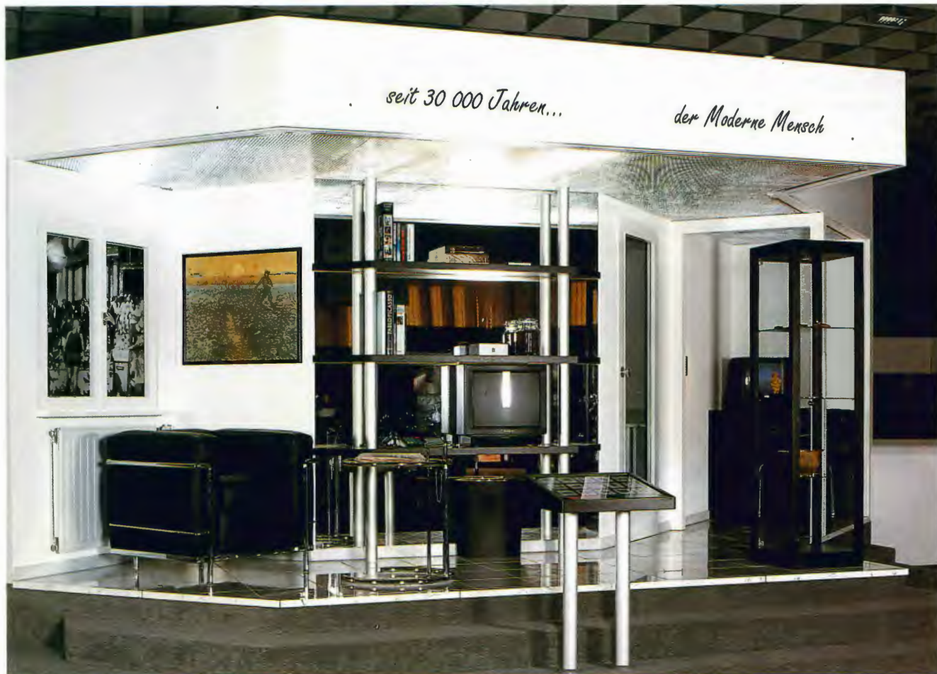
Vitrine zum Homo sapiens aus der Ausstellung „Entwicklung zum Menschen“