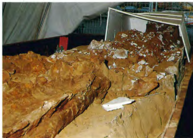
Der 10 Mio. Jahre alte Wal vor seiner Präparation

Ein besonders aufwendiger und schwieriger Auftrag erreichte die Zentrale Präparation im Jahr 1987. Im Frühjahr desselben Jahres hatten Mitarbeiter des Geologischen Landesamtes Nordrhein-Westfalen bei geologischen Kartierungsarbeiten in der Niederrheinischen Bucht ein 6,5 m langes Walskelett in einer Kiesgrube entdeckt. Nach der Freilegung des ca. 10 Mio. alten Fossils schalteten das Geologische Landesamt und das Rheinische Amt für Bodendenkmalpflege für die weiteren Präparationsarbeiten die Zentrale Präparation des Westf. Museums für Naturkunde ein. Die Mitarbeiter des Museums härteten zunächst die Knochen des Wals. Da das Rheinische Amt für Bodendenkmalpflege eine Blockbergung plante, mußten die Knochen für Bergung und Transport gesichert werden. Dies geschah durch Auflage einer Silikonschicht, die anschließend noch eine Polyesterschale erhielt. Die Silikonschicht erlaubte, später einen originalgetreuen Abguß der Fundsituation herzustellen (KLOSTERMANN, 1990). Die anschließende Blockbergung zerstörte durch die dabei auftretenden Scherkräfte das Fossil fast vollständig. Nahezu alle