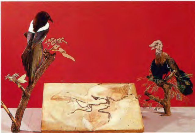
Der Urvogel in der Abteilung "Evolution"; Aufnahme 1978

1965 entstand die Ausstellung "Naturschutz in Westfalen". Der Ausstellungsraum erhielt durch Einbringung von Großfotos sein typisches Aussehen. Vor die Großfotos wurden die Präparate gestellt. Die Ausstellung zeigte vor allen Dingen die Tiere, die in den vergangenen Jahrhunderten in Westfalen ausgestorben waren (FRANZISKET, 1967 a).