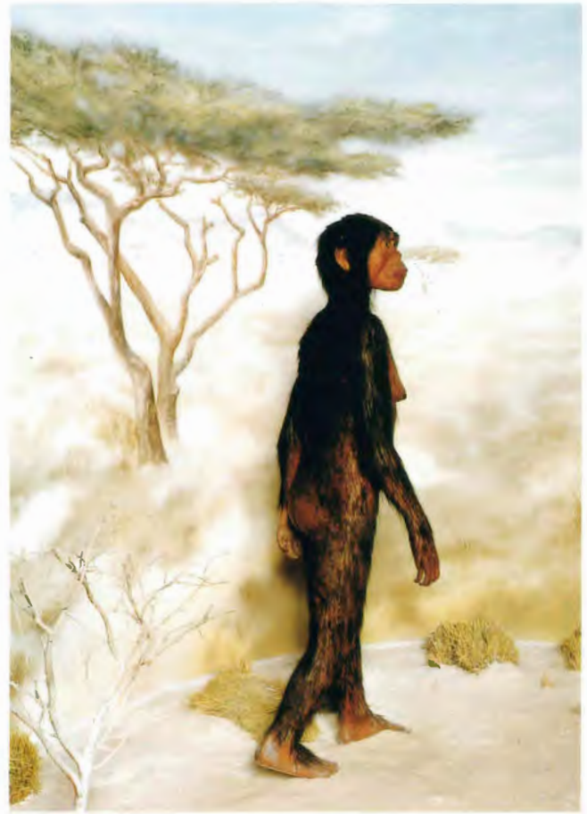
Rekonstruktion von Australopithecus afarensis aus der Ausstellung „Entwicklung zum Menschen“