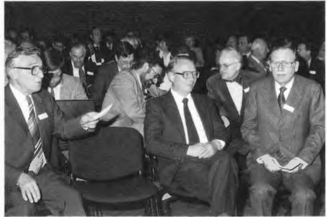
Jahrestagung des Deutschen Museumsbundes vom 9. - 11.5.83 im Westfälischen Museum für Naturkunde