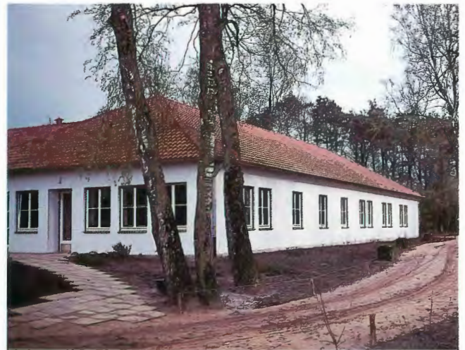
Das 1959/60 errichtete neue Stationsgebäude am Naturschutzgebiet "Heiliges Meer"; Aufnahme 1961

Der 1959 begonnene Neubau ... auf dem Platz des alten Gebäudes ist in drei Einheiten gegliedert. Der Wohntrakt umfaßt acht Räume mit insgesamt 40 Betten und einem Zimmer für den Stationsleiter. Im Verwaltungstrakt liegen Büro, Bibliothek ... sowie ein hydrobiologisches Labor, ... Der Lehrtrakt umfaßt den Unterrichtsraum und das kleine Museum." (FRANZISKET, 1974).