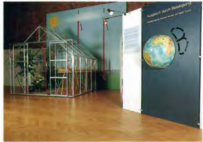
Die Sonderausstellung "Treibhauseffekt und Ozonloch"; Aufnahme 1989

derartige Themen sensibilisiert sind und eine große Bereitschaft mitbringen, sich mit einem solchen Thema intensiv auseinanderzusetzen. Die Übernahme durch die Museen in den o. a. Städten belegt, wie groß das Interesse auch bei anderen Museen an Ausstellungen zu derartigen Umweltthemen ist. Das Westf. Museum für Naturkunde wird in dieser Richtung konsequent weiterarbeiten. Ein Hinweis hierfür ist die Ausstellung "Trink?wasser", die ebenfalls an interessierte Museen weitergegeben wird. Da die Vorbereitung und Realisierung von Ausstellungen zu derartigen aktuellen Umweltthemen sehr zeitaufwendig ist, hat der Landschaftsverband Westfalen-Lippe durch Schaffung einer entsprechenden Planstelle für einen "wissenschaftlichen Referenten für ökologische Problemdarstellungen" die Basis geschaffen, daß in Zukunft in dieser Richtung verstärkt weitergearbeitet werden kann.