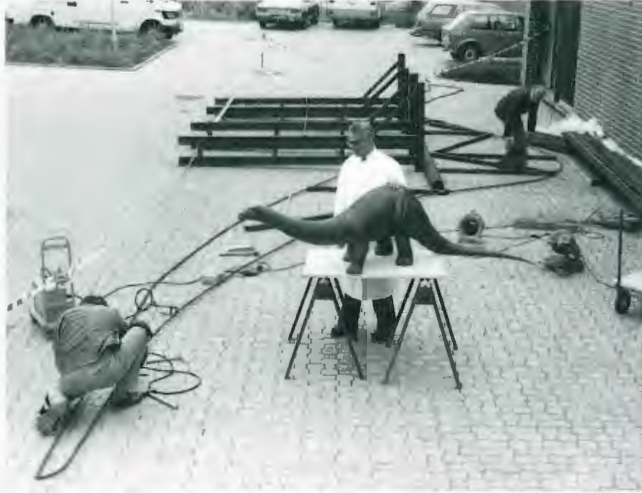
Erste Konstruktionsarbeiten für das lebensgroße Modell des Apatosaurus