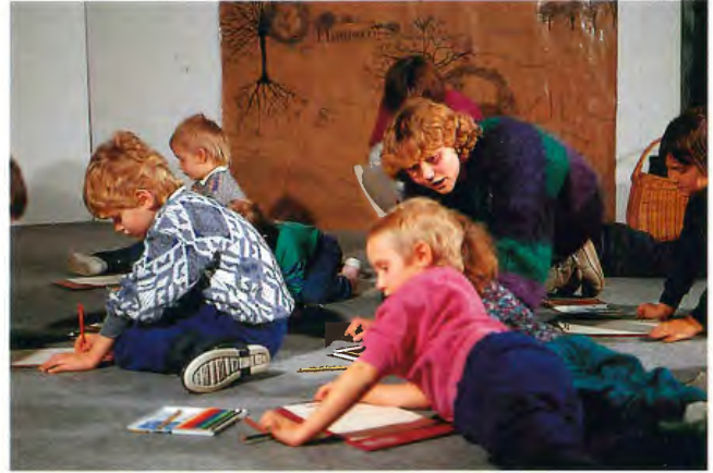
Eine museumspädagogische Aktivität im Museum

An den Sonntagen, an denen das Planetarium spezielle Kinderprogramme anbietet, finden im Museumskino ganz besondere Veranstaltungen für Kinder (und Erwachsene) statt. Der Chefpräparator des Museums hat verschiedene Programme erarbeitet. Während des Programmes "Fuchs, du hast die Gans gestohlen" singen alle Kinder gemeinsam Kinderlieder, in denen Tiere vorkommen. Dann werden diese Tiere als Objekte vorgestellt. Die Kinder dürfen die Präparate anfassen und erfahren außerdem Interessantes über Lebensweise und Besonderheiten der Tiere. Es gibt noch zwei weitere Programme,