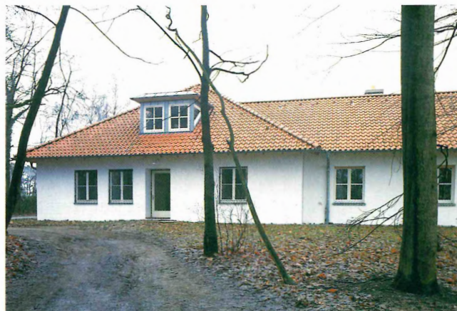
Die Außenstelle am Naturschutzgebiet "Heiliges Meer" nach Erweiterungs- und Anbaumaßnahme; Aufnahme 1992

1989 begannen die Umbaumaßnahmen, die 1990 im wesentlichen abgeschlossen wurden. Die Baumaßnahme hat zu einer wesentlichen Verbesserung des Raumangebotes geführt. Insgesamt wurden die Übernachtungsmöglichkeiten von 40 auf 32 reduziert. Die Gästezimmer sind in der Regel mit zwei