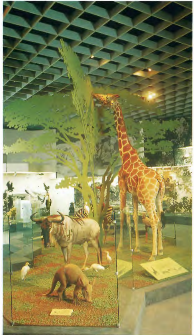
Blick in die Abteilung "Tiergeographie"

Mit der Eröffnung der Ausstellung im neuen Museum ergaben sich gleichzeitig viele neue Arbeitsmöglichkeiten, die das nachfolgende Kapitel erläutert.