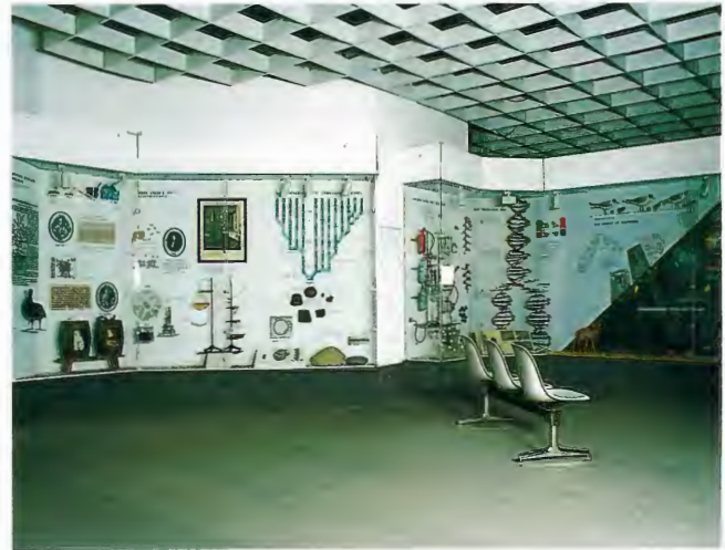
Die Abteilung "Evolution der Organismen" nach der Eröffnung am 22.7.84; Aufnahme 1988