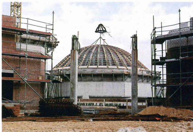
Richtfest am 29.02.80

Der erste Preisträger erhielt auch den Planungsauftrag des Neubaus. In der Vorplanungsphase von 1973 bis Anfang 1977 wurde das Planungsprogramm ständig verbessert. Die erarbeiteten Vorentwürfe und Kostenschätzungen dienten als Grundlage für die mehrjährigen Verhandlungen mit dem Finanz- und Kultusministerium des Landes Nordrhein-Westfalen. Im Frühjahr 1977 konkretisierten sich überraschend die Genehmigungsaussichten, und Ende 1977 bewilligte das Land Nordrhein-Westfalen einen Zuschuß von 6,5 Mio. DM. Bei einer geplanten Bausumme von 29 Mio. DM verblieb nach den genannten Zuschüssen der Stadt Münster und des Landes ein vom Landschaftsverband Westfalen-Lippe aufzubringender Betrag in Höhe von 14,5 Mio. DM.