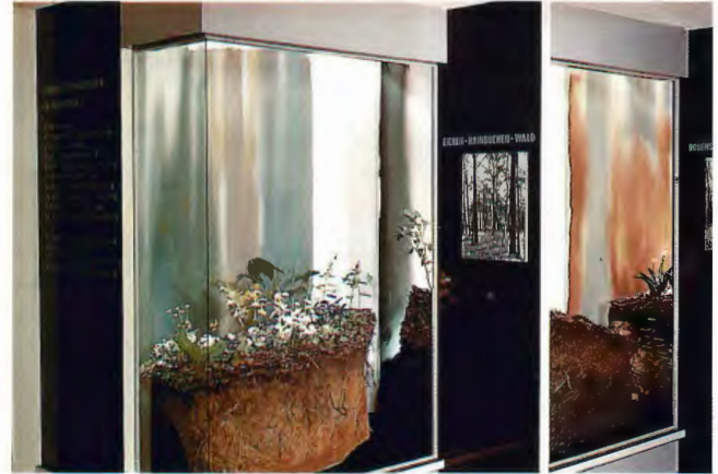
Vitrine "Eichen-Hainbuchenwald" der Abteilung "Pflanzengesellschaften"; Foto 1961

Unter Franziskets Leitung wurde die Schausammlung des Museums ganz im Sinne der von Rensch formulierten Forderungen weiter ausgebaut. Dabei griff Franzisket auch neue Themen auf: 1961 konnte die Ausstellung "Pflanzengesellschaften in Westfalen" eröffnet werden. Wegen der besonderen präparationstechnischen Schwierigkeiten, Pflanzen dauerhaft zu präparieren, waren Pflanzenausstellungen bis dahin praktisch unmöglich gewesen. Da sich nach Franziskets damaliger Meinung breite Laienkreise für das Kennenlernen heimischer Tier- und vor allem auch Pflanzenarten interessierten, entwickelten die Mitarbeiter des Museums Methoden zur Darstellung von Pflanzen (FRANZISKET, 1962; HABER, 1961). In Zusammenarbeit mit einem künstlerischen Berater