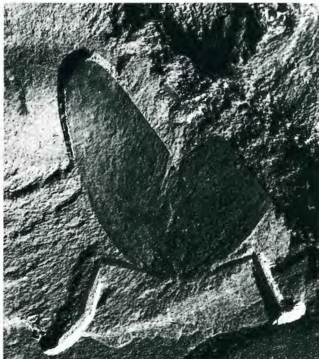
Freipräpariertes Insekt (Kemperala) aus der Grabung Hagen-Vorhalle; Alter: ca. 300 Mio. Jahre, Flügelspannweite: 61 mm

durch einen paläontologischen Präparator verstärkt. Nach diesem Einstieg erkannte man relativ schnell, daß noch weitere Schritte folgen mußten. Zunächst wurde eine paläontologische Schriftenreihe gegründet, in der die wissenschaftlichen Ergebnisse der paläontologischen Arbeiten zusammengetragen sind. Die Zeitschrift "Geologie und Paläontologie in Westfalen" erschien erstmalig 1983 in der gemeinsamen Herausgeberschaft des Westf. Museums für Archäologie als Amt für Bodendenkmalpflege, ebenfalls eine Einrichtung des Landschaftsverbandes Westfalen-Lippe, und des Westf. Museums für Naturkunde. Seit 1992 ist das Westf. Museum für Naturkunde alleiniger Herausgeber dieser Zeitschrift. Das Westf. Museum für Naturkunde nimmt seit 1983 die Aufgaben der Zentralen Präparationswerkstatt für das Land Nordrhein-Westfalen wahr. Es war daher auch innerhalb der paläontologischen Präparationswerkstatt, die im Westf. Museum für Archäologie fehlte, gut ausgerüstet. Zugleich sollten die im Rahmen der Paläontologischen Bodendenkmalpflege geborgenen Funde nicht fachfremd im Westf. Museum für Archäologie magaziniert oder ausgestellt werden, sondern im Westf. Museum für Naturkunde, das über eine große naturwissenschaftliche Ausstellung verfügt. Durch diese Verknüpfungen kam man innerhalb der Verwaltung des Landschaftsverbandes Westfalen-Lippe zu der Auffassung, daß es günstig