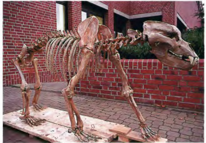
Ein Höhlenbär-Skelett für das Städt. Museum Warstein

häufig nicht den anatomischen Gegebenheiten. Danach kann die Konservierung der fossilen Knochen erfolgen. Die Objekte haben vielfach in früherer Zeit schon eine entsprechende Anwendung erlebt. Ist dies der Fall, muß die in der Vergangenheit angewendete Konservierungsmethode ermittelt und auf ihre Verträglichkeit mit der geplanten Konservierungsmaßnahme geprüft werden. Würde dies nicht geschehen, könnten während der Konservierung unerwünschte Reaktionen am Fossil auftreten, die beispielsweise Verfärbungen hervorrufen. Gerade dieser Arbeitsgang kann sich sehr aufwendig gestalten. Nach der Konservierung werden fehlende Teile der fossilen Knochen mit Kunststoff ergänzt. Hier dienen vollständige Originale als Vorlage, so daß die Rekonstruktion in allen Einzelheiten der Natur entspricht. Sind alle erforderlichen Skeletteile konserviert, ergänzt oder kopiert, werden sie zu einem Skelett zusammengefügt. Die Tragkonstruktion, in der Regel Flach- oder Rundeisen, soll unsichtbar sein bzw. sich bei der Betrachtung dem Objekt unterordnen. Außerdem ist eine Skelettmontage erwünscht, die modernen paläontologischen Erkenntnissen genügt. Die komplette Montage des Höhlenbären ist seit dieser Zeit im Städt. Museum in Warstein zu sehen.