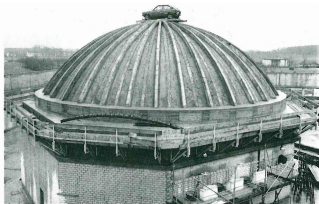
"Der sicherste Parkplatz der Welt"; Rohbau des Planetariums im Januar 1980, wenige Wochen vor dem Richtfest

Wegen der Nachbarschaft des neuen Zoologischen Gartens und der damit verbundenen Attraktivität und der Größe des Museums ging man davon aus, daß jährlich ca. 250 000 Menschen das neue Naturkunde-Museum besuchen würden. Aufgrund des Wettbewerbes gingen 39 Arbeiten ein. Den ersten Preis erhielt das Planungsteam "Architektur und Städtebau" aus Krefeld. Dem Team gehörten die Architekten Fohrer, Himmelein, Klinkhammer, Schneiders und Wirtz an. Die Architekten legten das Planetarium in die Mitte der ca. 3 500 qm großen Ausstellungshalle. Diese besteht aus einem ebenerdigen Gebäude mit freitragendem Dach.