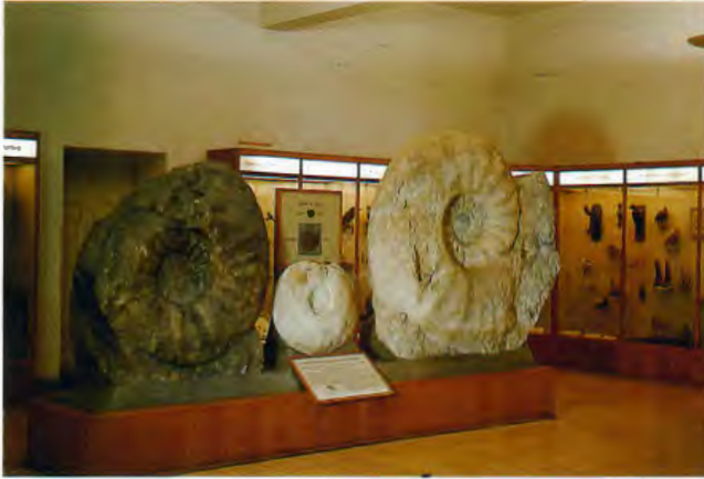
Die Riesenammoniten im zentralen Ausstellungsraum des alten Museums; Foto 1954