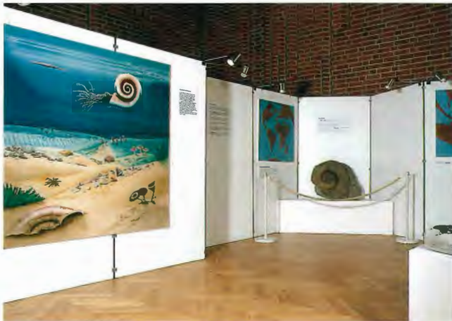
Die Sonderausstellung "Neue Funde aus der Kreidezeit Westfalens" im Vortragssaal aufgestellt; Aufnahme 1987