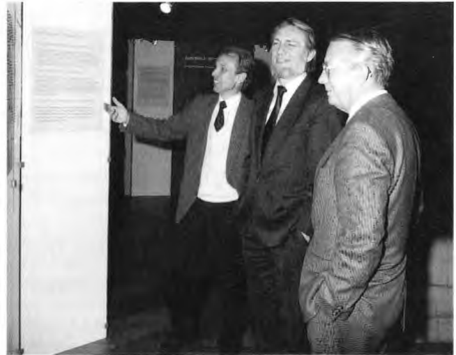
Am 23.11.89 besucht der Minister für Umwelt, Raumordnung und Landwirtschaft des Landes Nordrhein-Westfalen, K. Matthiesen (Mitte) die Sonderausstellung "Treibhauseffekt und Ozonloch". Rechts: H. Neseke, Direktor des Landschaftsverbandes Westfalen-Lippe

Mit der Sonderausstellung "Treibhauseffekt und Ozonloch" beschrift das Westf. Museum für Naturkunde den neuen Weg, ein - wegen des Mangels an Objekten - eigentlich museal nicht darstellbares Thema in eine Ausstellung umzusetzen. Außerdem griff es damit ein aktuelles und auch brisantes Thema auf. Der Erfolg beim Publikum war sehr groß. Es hat sich gezeigt, daß vor allen Dingen Jugendliche und junge Erwachsene für