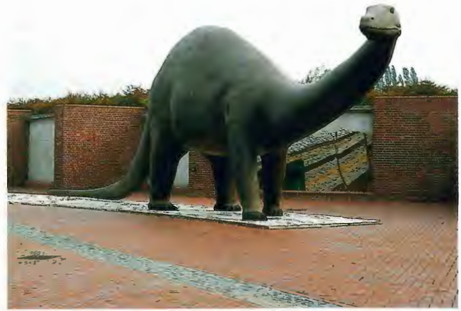
Der Apatosaurus vor seiner Fährte