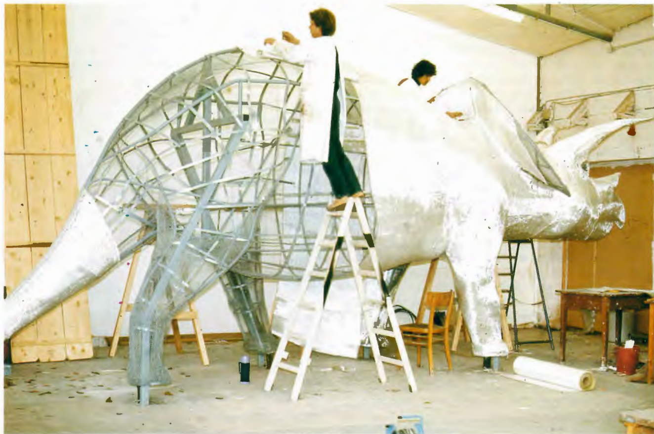
Ein Triceratops entsteht

Großexponaten den entsprechenden Raum benötigte, war für mehrere Jahre eine Fabrikhalle angemietet worden. Dort entstanden u. a. die 4,25 m hohe Dermoplastik einer Giraffe und die lebensgroße Rekonstruktion eines Triceratops. Der Triceratops sollte vor dem Haupteingang des Museums aufgestellt werden.