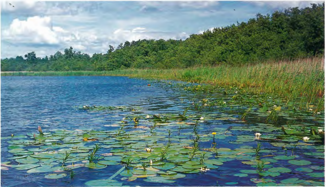
Das Große Heilige Meer

zu erforschen. Diese Ergebnisse sollen beim Ankauf umliegender Ländereien zwecks Abpufferung des Naturschutzgebietes Berücksichtigung finden. Der Landschaftsverband Westfalen-Lippe bemühte sich in der Vergangenheit sehr um den Ankauf umliegender Flächen. Während das Grundstück 1927 noch 55 ha groß war, hatte es 1984 bereits eine Größe von 70 ha (REHAGE, 1985). 1992 gehören dem Landschaftsverband Westfalen-Lippe in diesem Bereich ca. 90 ha. Diese Ankäufe waren durch finanzielle Unterstützung des Landes Nordrhein-Westfalen möglich.