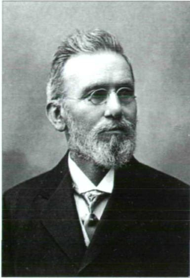
Abb. 1: Robert Latzel; Foto aus der „Ehrenmappe des Naturwissenschaftlichen Vereins für Kärnten“.

schwer und konnte sein letztes Werk über Collembolen nicht mehr fertig stellen. Am 15. Dezember 1919 starb Robert Latzel in Klagenfurt (STAGL & MILDNER 2000).