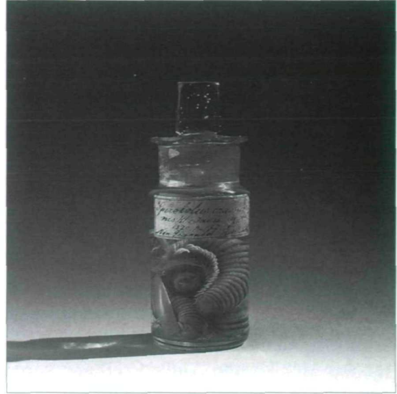
Abb. 5: Spirobolus crassicornus Humbert & Saussure, 1870, Holotypus, gesammelt von Emanuel von Friedrichsthal in Neu Granada, Nicaragua.

Grundlegende Werke wurden von Attems verfasst, in KÜKENTHALS Handbuch der Zoologie (1926-1930) der Beitrag über Myriapoden, sowie Myriapoden-Monographien, die u. a. im „Tierreich“ (1929, 1930, 1937, 1938, 1940) erschienen sind. Attems hat unzählige neue Familien, Gattungen, Untergattungen, Arten (1944 waren es bereits 1.500!), Unterarten und Varietäten beschrieben, die alle im Anhang des Nachrufes von STROUHAL (1961) aufgelistet sind. Viele seiner Neubeschreibungen sind natürlich heute aus der Sicht der modernen Systematik äußerst problematisch, viele seiner Erstbeschreibungen sind als Synonyme erkannt worden, doch tut dies der Gesamtheit seiner gewaltigen Leistung keinen Abbruch. Er, der unermüdlich mit Myriapoden beschäftigt war, gilt unbestritten als einer der größten Myriapodenspezialisten aller Zeiten. Er war, wie STROUHAL (1957) anführt, ein durch zahlreiche Publikationen in Fachkreisen aller Erdteile bekannter Forscher, der dadurch auch zum Ansehen des Museums und zum Ruhme der österreichischen Wissenschaft viel beigetragen hat.