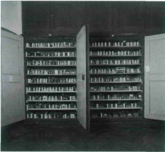
Abb. 6: Zwei Kästen der Myriapodensammlung des Naturhistorischen Museums in Wien.