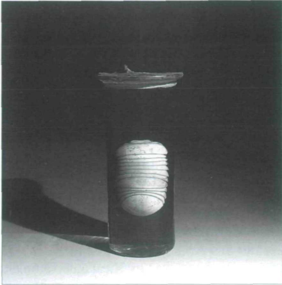
Abb. 4: Sphaerotherium hippocastanum (Gervais 1847), Riesenkugler, gesammelt von Ida Pfeiffer auf Mauritius.