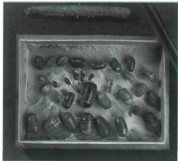
Abb. 7: Schachtel mit Trockenpräparaten.

net, der überwiegende Teil in Pulvergläsern mit 70% Alkohol aufbewahrt (Abb. 6), aber auch zahlreiche Mikropräparate sind vorhanden. Die Zahl der Trockenpräparate ist sehr gering, die Tiere sind nicht gut erhalten, sie stellen aber einen historischen Wert dar (Abb. 7).