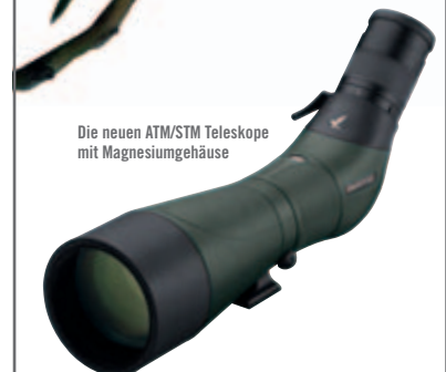
Die neuen ATM/STM Teleskope mit Magnesiumgehäuse