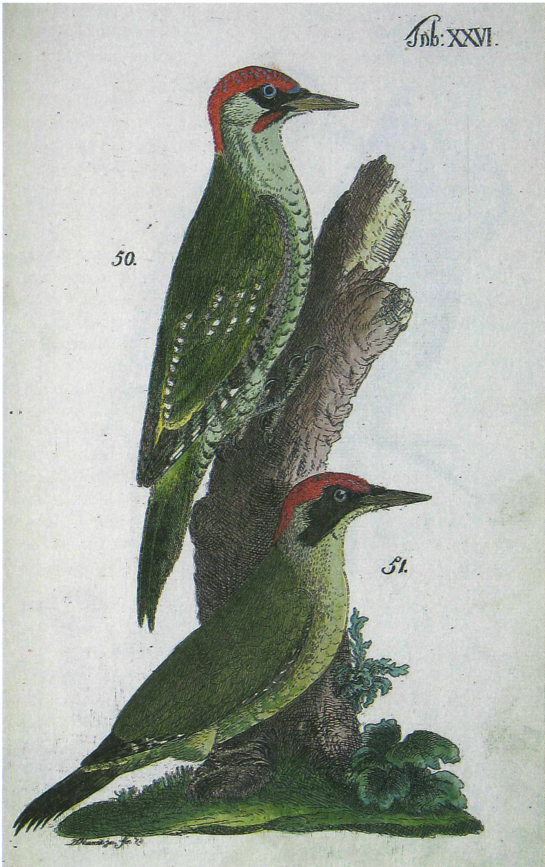
Abb. 3. Grünspecht-Männchen und Weibchen Picus viridis . Handcolorierte Foliotafel Nr. 26 aus Band 1 der NGI. Coll. J. Staudtner.