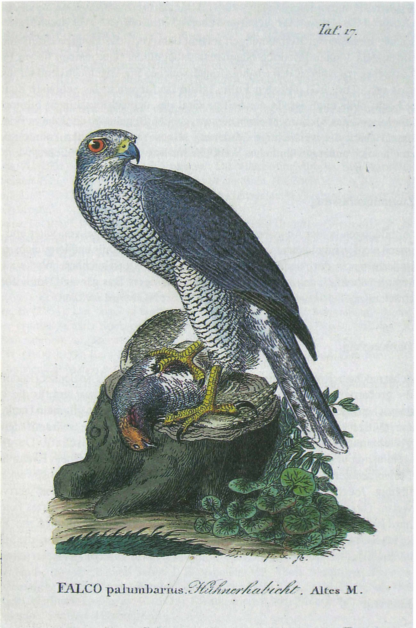
Abb. 6. Habicht – altes Männchen Accipiter gentilis . Handcolorierte Octavtafel Nr. 17 aus Band 1 der NG2. Coll. J. Steudtner.