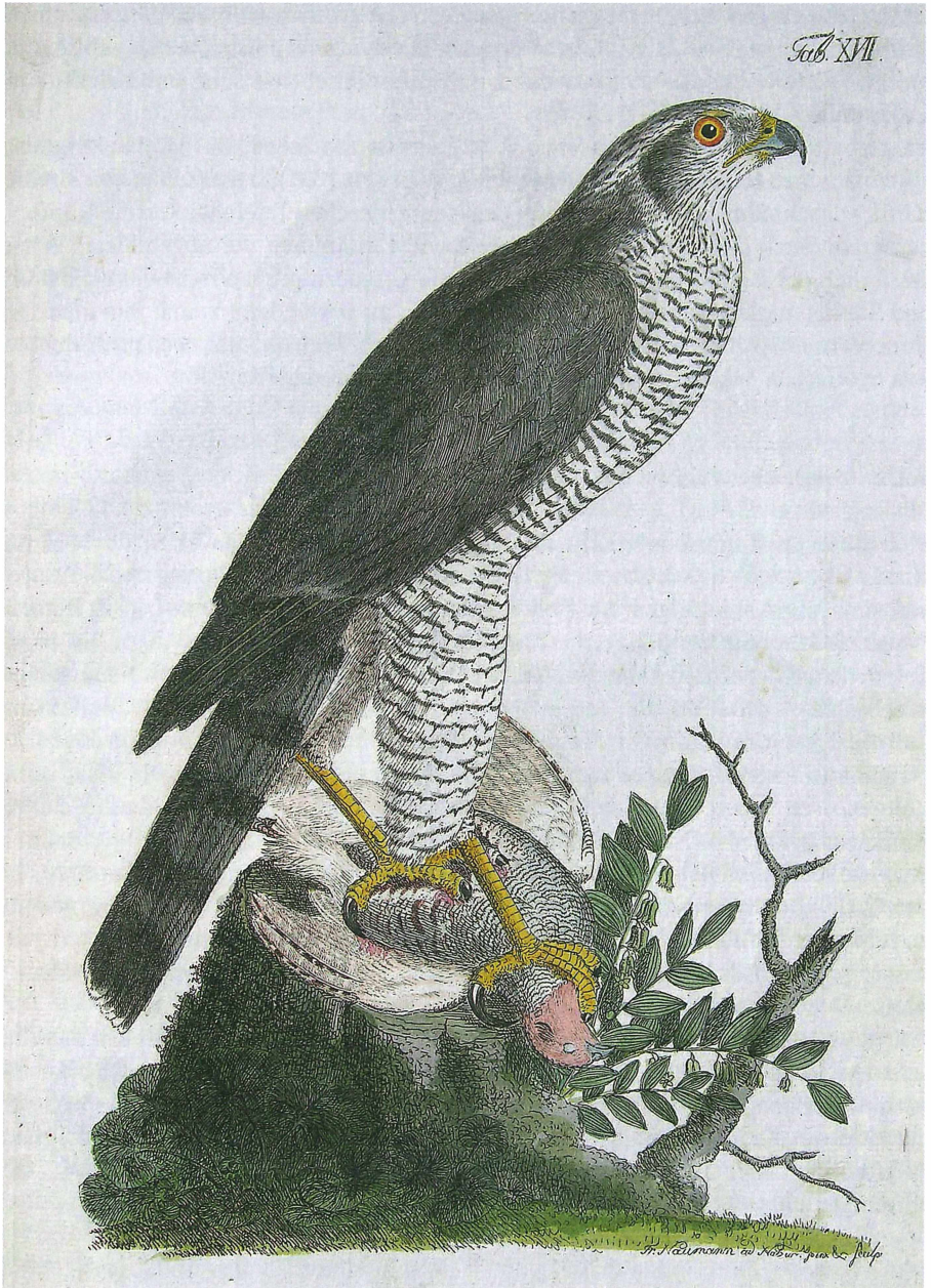
Abb. 5. Adulter Habicht Accipiter gentilis . Handcolorierte Foliotafel Nr. 17 aus Band 1 der NGI. Coll. J. Steudtner.