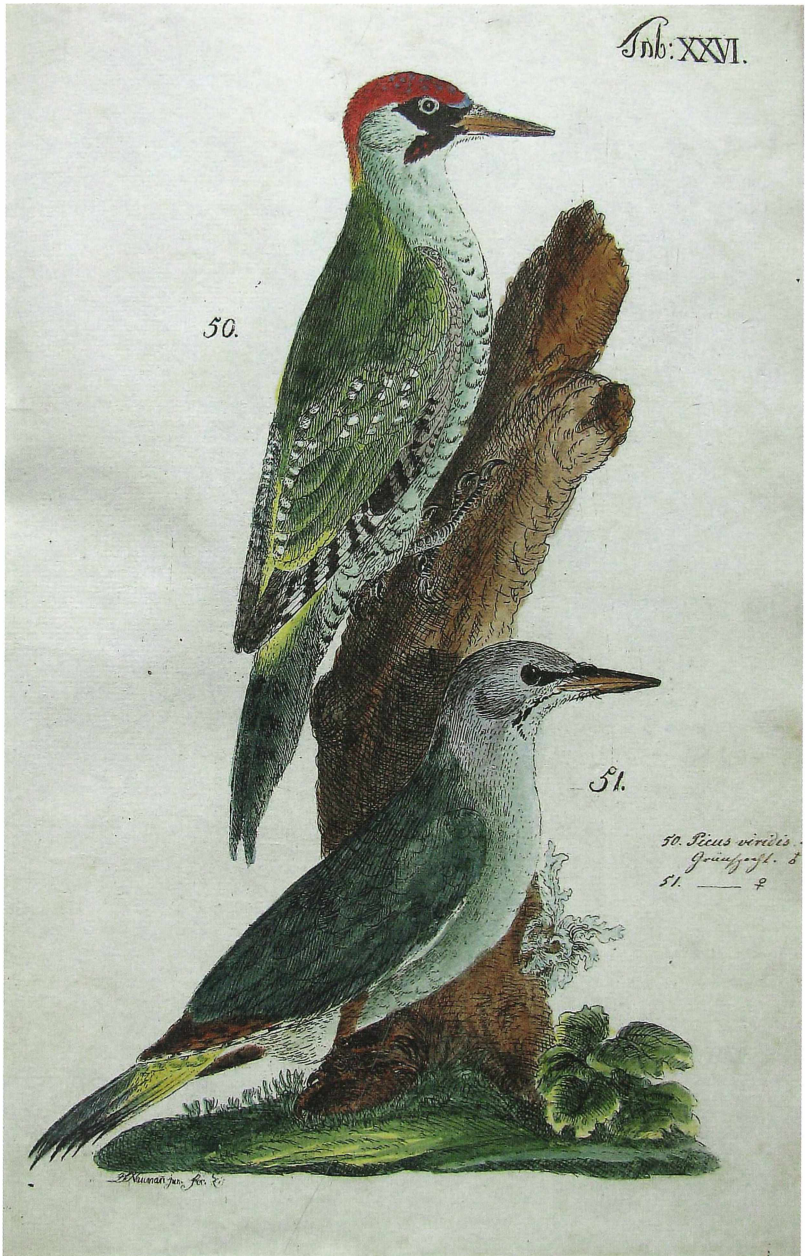
Abb. 2. Grünspecht-Männchen Picus viridis und Grauspecht-Weibchen Picus canus . Handcolorierte Foliotafel Nr. 26 aus Band 1 der NG1. Coll. G. Goetz.