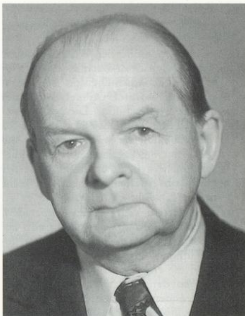
Abb. 4. Prof. NIKOLAJ A. GLADKOW aus Moskau (ca. 1972).

Die Schlacht bei Wjasma zählt in der Geschichte des Zweiten Weltkriegs zu den größten Erfolgen der deutschen Armeen: Hier wurden binnen weniger Wochen 80 Divisionen der Roten Armee ausgeschaltet und etwa 650.000 sowjetische Soldaten in Gefangen-