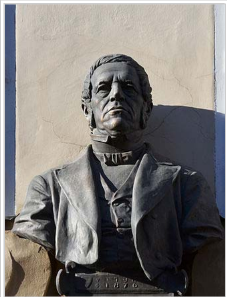
Büste von František Palacký, erstellt von Josef Václav Myslbek

Königlichen böhmischen Gesellschaft der Wissenschaften in Prag, auswärtiges Mitglied der Bayerischen Akademie der Wissenschaften in München und zahlreicher weiterer wissenschaftlicher und kultureller Vereinigungen und erhielt als Historiker in der tschechischen Presse den Ehrentitel eines „Otec národa“ (Vater der Nation). Die Universität in Olmütz trägt seit 1990 seinen Namen als Palacký-Universität Olmütz.