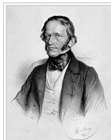
František Palacký, Lithographie von Adolf Dauthage 1855.