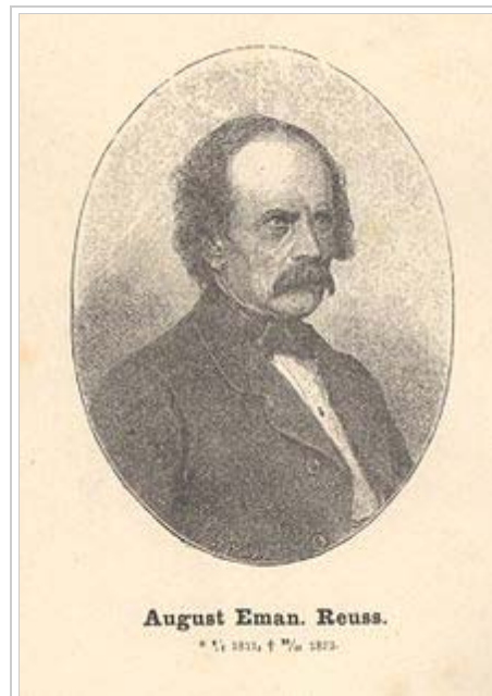
August Emanuel Reuss