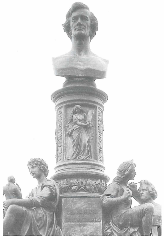
Denkmal des Professors ERNST RIETSCHEL auf der Brühlischen Terrasse in Dresden.

Doch ist eine Schausammlung letztendlich ein steriles Designprodukt, wenn keine lebendige Beziehung zur Forschung und zu deren wissenschaftlichen Ergebnissen besteht. Zwar sollte man Fachwissenschaftler wegen ihrer speziellen Denk- und Darstellungsweise, für die Allgemeinverständlichkeit nicht zu den wichtigsten Kriterien zählt, im allgemeinen von der praktischen Gestaltung einer Ausstellung fernhalten, aber deren Forschungsergebnisse und ihre Denkgebäude sind