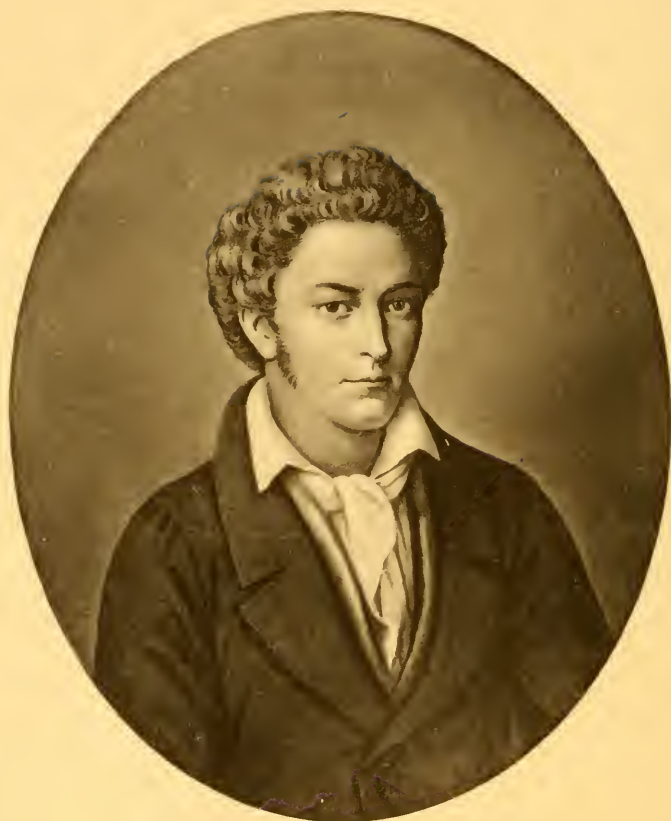
Dr. Eduard Rüppell

in seinem 30. Jahre, nach einem Oelgemälde.