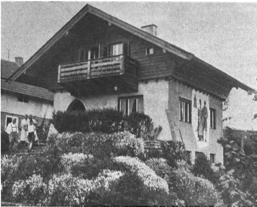
Abb. 3: Das „Schäffer-Häusl“ in Dießen am Ammersee.

sicht auf die Pensionierung erleichterte ihm das Leben sichtlich, er brauchte zu seiner Entlastung nur noch die Abiturklasse zu unterrichten.