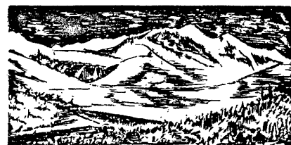
Der Mount Steller, die höchste Erhebung der Beringinsel (zeitgenössische Darstellung).

Unermüdet war Steller um die Männer besorgt, sie brauchten Kräuter, Wasser und frisches Fleisch. Die Füchse auf der Insel wurden immer dreister, sie griffen die Kranken an, gruben die Leichen aus. Jedes getötete Tier zog neue Füchse an; das Gesetz der Insel hatte sie zu Totengräbern ausersehen, zu Vernichtern des Kranken, Schwachen, Verwundeten, ob es nun Robbe, Otter, Eisfuchs – oder Mensch hieß. Die Männer litten Unvorstellbares.