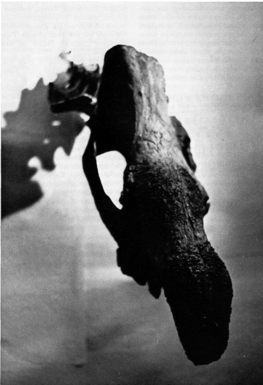
Schädelrest mit den ersten fünf Halswirbeln (Oö. Landesmuseum).

Ein Bewohner unserer eiszeitlichen Lößsteppen und Tundren