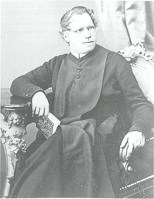
Abb. 7: Meynrad Taurer von Gallenstein. Repro. P. Mildner

Buchboden 10/12 1884. Grafen von Herrn Freund Liegel! Ihre allzu gute, damit ich die Zeit nicht verschwende, habe ich Ihnen die Entschuldigun- gen dieser zwei Hefen in 6 Exemplaren, welche ich mir zum Zweck anbehalte. Die Prüfung der Facsimile ist mir sehr un- züchtig, und für diesen Fall kommt. Ich habe nun Prüfung von dem Herrn vorgenommen. Die Druckfehler bemerke ich auf eine ganz Prüfung von H. St. Prüfer, und was schließlich eine solche Prüfung nur nicht von mir durchzuführen; und eine meine Berücksichtigung gemacht und ich acceptiert habe, und schließlich Ein solches mit wenigstens 1000 Exemplaren folgenden Carabon: monticola, Hellus, Solici, cavernosus, Karohardicus, maritimus, Parreyssi, Latrallii, Parleri, Fairmairei, splendens, exaratus, planatus etc. Von H. St. Prüfer bemerke ich Alaus Parreyssi, Carabus; Adonis d. Die folgende Varietät von Merli, und Procerus Panoxi. Helops giganteus u. Ketteri etc. Ihre Güte ist mir sehr dankbar, und ich mit besten Wünschen für die Mit freundschaftlichem Gruß Johann Schaschl