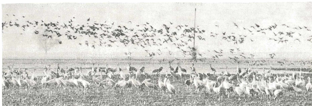
Abb. 10. Kraniche und Gänse auf dem Durchzug.