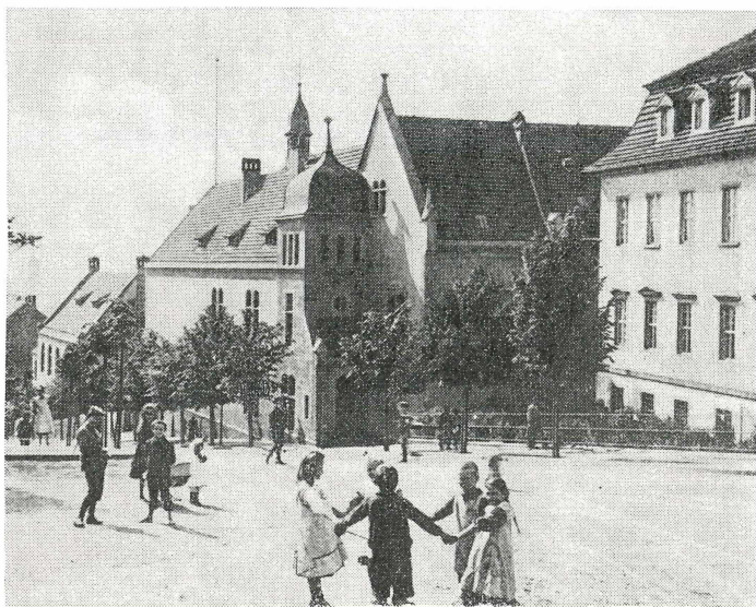
Abb. 5. Das Stiftsgymnasium Zeitz um 1900.