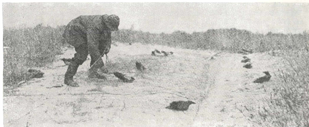
Abb. 9. Krähenfänger auf der Kurischen Nehrung. Von den kurischen Fischern wurden die hier durchziehenden Nebelkrähen einst ausschließlich zu Speisezwecken gefangen. Im Jahr 1903 begann THIENEMANN mit solchen Krähen sein „Beringungs-Experiment“.