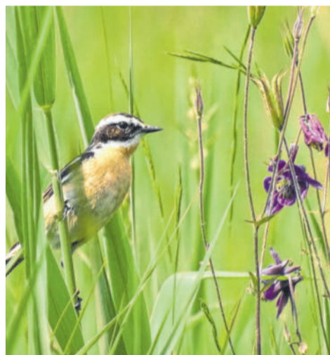
Eindrucksvolle Fotos von Jürgen Ulmer.

siedelung und Bau neuer Straßen sowie die immer intensivere Landwirtschaft, die auch für die Entwässerung bzw. Austrocknung von Riedgebieten sowie den Pestizideinsatz verantwortlich ist“, betont der Naturfreund. „Vielen Menschen ist nicht wirklich bewusst, was die Abnahme der Artenvielfalt für uns alle bedeutet und welche katastrophalen Auswirkungen dies auf unser Dasein haben wird. Jeder Einzelne von uns kann