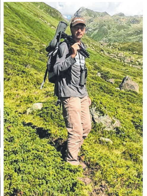
Erhaltung und Schaffung von Naturräumen ist Ulmer Herzensangelegenheit.