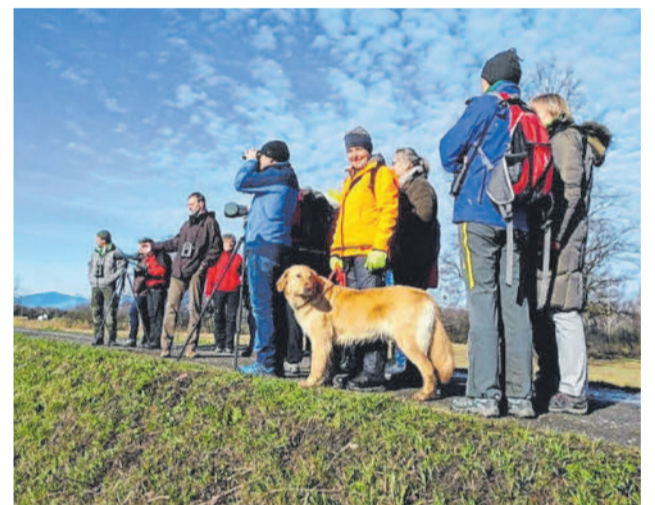
Interessierten die Natur und Tierwelt näher bringen.

voll erweitert werden, da das Radfahren in Vorarlberg sehr beliebt ist.“