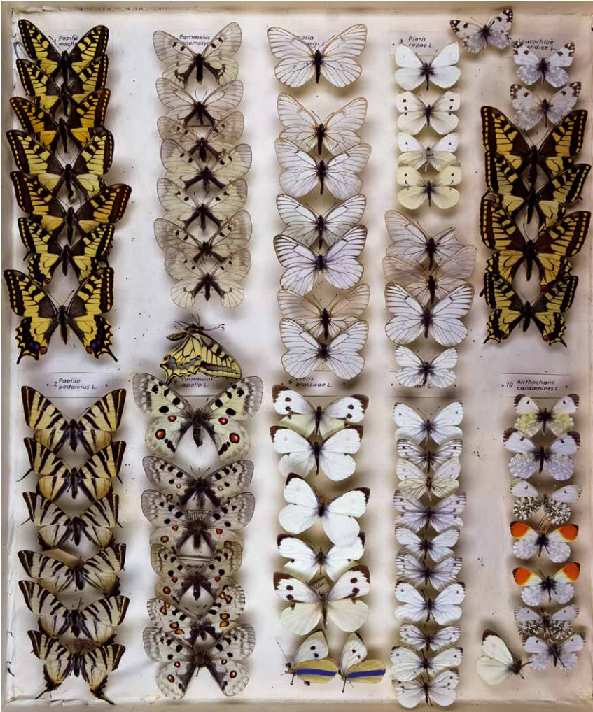
Abb. 4 Sammlung Paläarktische Tagfalter: Papilionidae, Pieridae, I-0343-C, Foto: CARL AHNER, 2011.