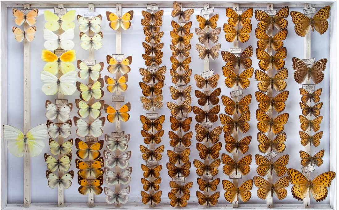
Abb. 2 Sammlung ZABEL: Pieridae, Nymphalidae, I-0330-C, Foto: CARL AHNER, 2011.