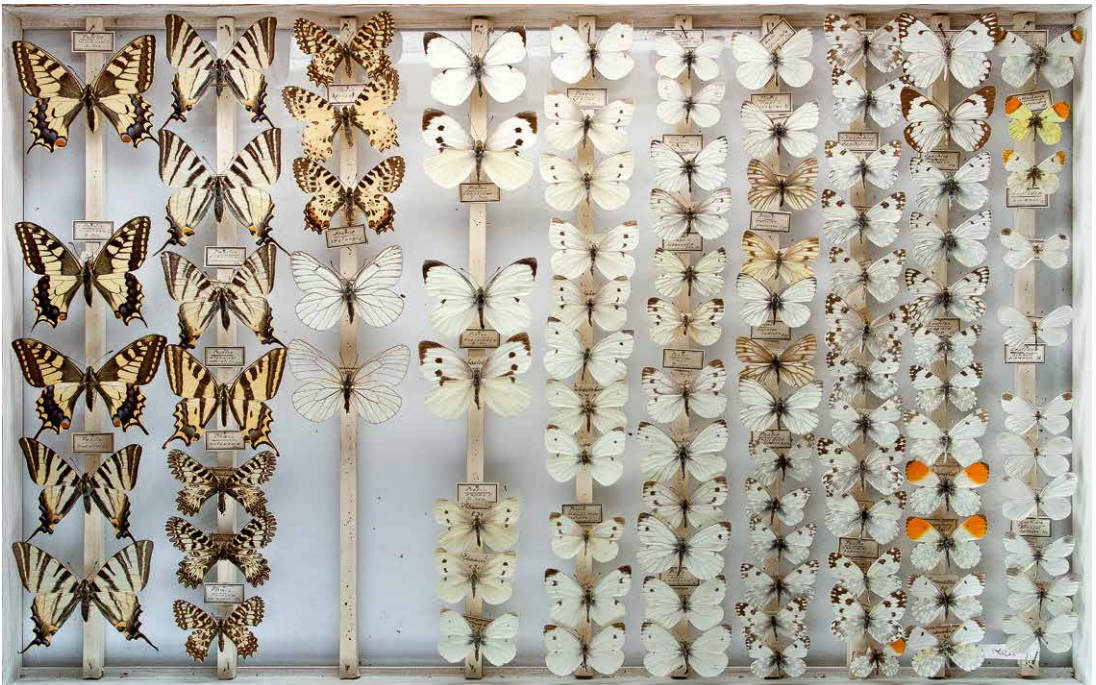
Abb. 1 Sammlung ZABEL: Papilionidae, Pieridae, I-0329-C, Foto: CARL AHNER, 2011.

D = Bundesrepublik Deutschland (BY = Bayern, BW = Baden-Württemberg, SN = Sachsen, BB = Brandenburg, BE = Berlin, MV = Mecklenburg-Vorpommern, TH = Thüringen, ST = Sachsen-Anhalt); B+H = Bosnien und Herzegowina; A = Österreich; CH = Schweiz; I = Italien; F = Frankreich; H = Ungarn; E = Spanien; CZ = Tschechien