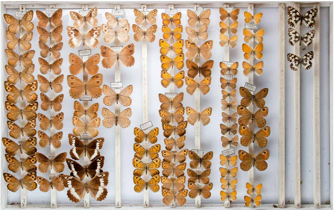
Abb. 3 Sammlung ZABEL: Nymphalidae-Satyrinae, I-0331-C, Foto: CARL AHNER, 2011.