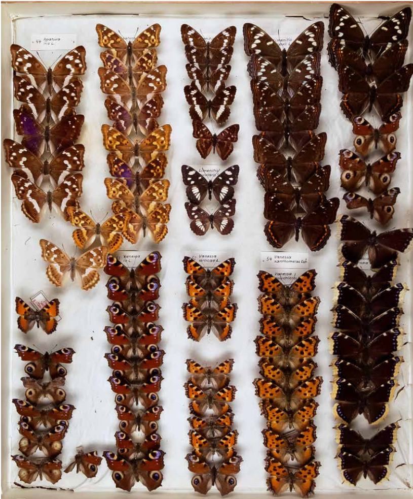
Abb. 5 Sammlung Paläarktische Tagfalter: Nymphalidae, I-0347-C, Foto: CARL AHNER, 2011.