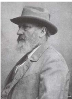
Eduard Sueß (1831-1914)

Am Anfang seiner tektonischen Studien kümmerte sich Sueß kaum um diese Diskrepanz, weil von den Abschiebungen beherrschte Einbruchgebiete durch die radiale, d. h. vertikale Komponente der Schrumpfung ohne weiteres erklärbar erschienen. Alle diese Einbruchgebiete, die Sueß damals vorschwebten, besaßen aber mehr oder minder isometrische oder nur wenig gestreckte Planformen wie Ozeane und Kesselbrüche. Selbst wenn Sueß von „Senkungslinien“ sprach, bezeichnete er sie als „gemeinschaftlich die Lage eines Senkungsfeldes“ zeichnend ( Das Antlitz der Erde , Bd. Ia, S. 165). Der Rheingraben, den er die „große Grabenverwerfung des Rheins“ nannte ( Antlitz der Erde , Ib, S. 392) war ihm bekannt, ebenso die Deutung als von Abschiebungen begrenzter Gesteinskeil durch Élie de Beaumont (1798-1874). Sueß zitierte Élie de Beaumont und schien seine Deutung zu loben, aber auf derselben Seite machte er, ohne es deutlich zu sagen, klar, dass für ihn der Rheingraben nichts anderes als ein Senkungsfeld, verursacht durch radiale Brüche, war ( Antlitz der