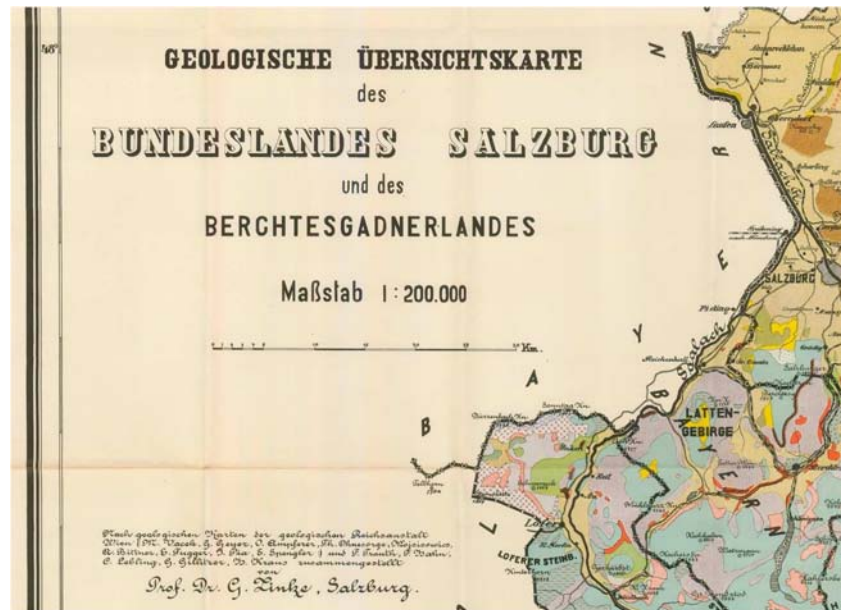
Abb. 1: Ausschnitt aus der geologischen Übersichtskarte des Bundeslandes Salzburg (1:200.000) von G. ZINKE (1925). Originalgröße: ca. 830 x 630 mm.

Literatur lediglich eine handverlesene Zahl fachlich divergierender Veröffentlichungen von Zinke aufweist, weckte das Interesse nach dem fachlichen Werdegang und Wirken Gustav Zinkes. Es fällt auf, dass Zinke nie in den Publikationsorganen der Geologischen Reichs-, später Bundesanstalt (insbesondere geologische Aufnahmeberichte) veröffentlichte.