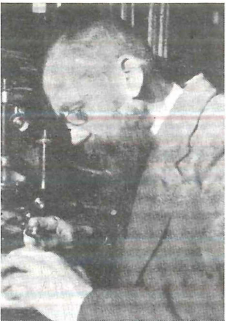
H. Zschacke (aus Mattick 1939)

Biogr. Lit.: Tobler (1909, Portr., Bibl.), Huneck et al. (1973), Sackmann (1985), Dörfelt & Heklau (1998) [Dö]