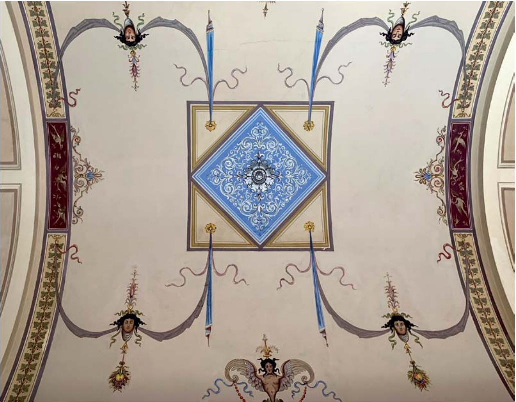
Abb. 4. Kuppelungang, Dekorationsmalerei von Franz Schönbrunner.

(Ausführung v. Malerarbeiten in den Hofmuseen Dr. Franz Schönbrunner Nachtrags-Akkord-Protokoll ex 1883, ex 1886 21.6.1888, Hofbauk. 36.11).