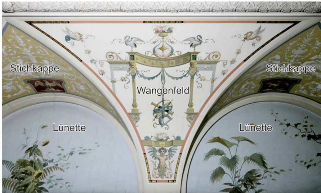
Abb. 6. Bezeichnung der bemalten Bereiche.

Beide Aspekte trugen sicherlich dazu bei, dass in diesem Bereich des Museums auch eine von den sonstigen Räumen abweichende Dekorationsmalerei vorzufinden ist, die sich nur in bestimmten Zonen an den Prinzipien der vorher besprochenen „Groteskenmalerei“ orientiert. Abbildung 6 zeigt die verschiedenen Zonen der Dekorationsmalerei.