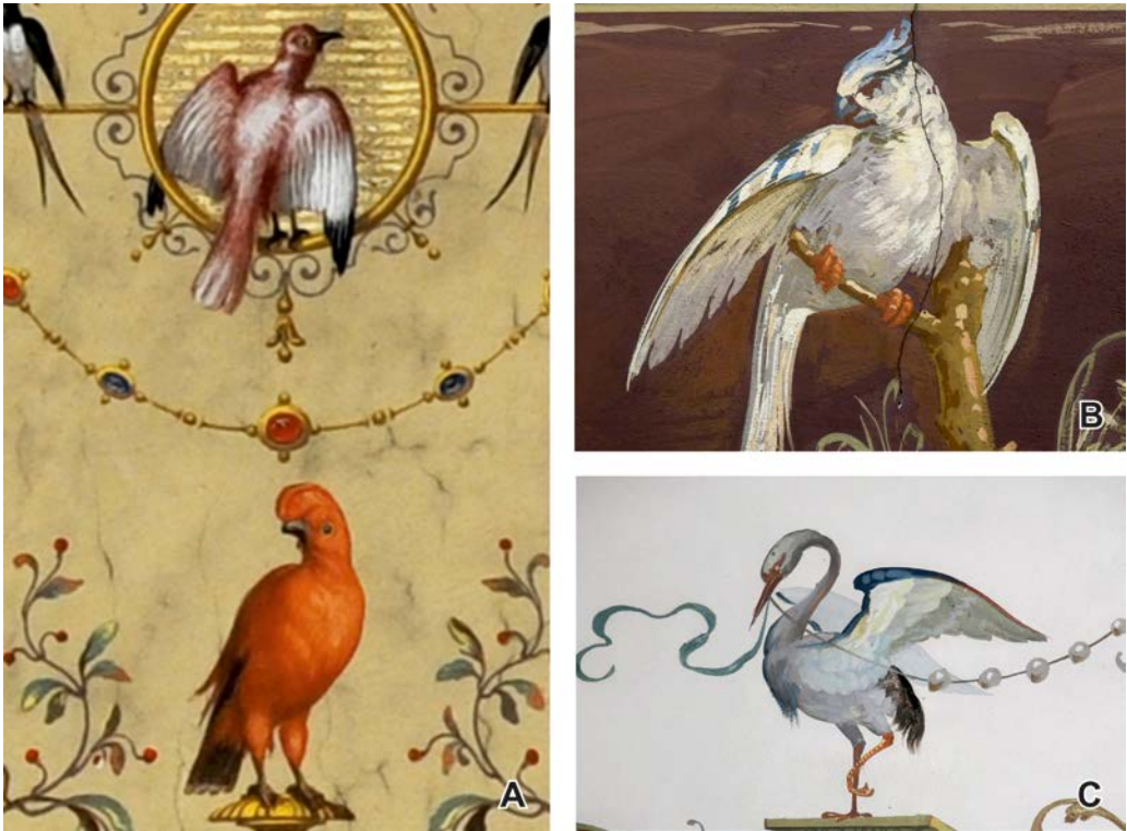
Abb. 14. A: Roter Vogel aus einer Lünette von Pietro Isella, Saal 32, Foto: Alice Schumacher; B–C: zwei weiße Vögel aus der Dekorationsmalerei der kleinen Feststiege, Fotos: Anna Boomgarden.

möglich. Vor allem die Arbeiten von Pietro Isella sind motivisch zwar partiell ähnlich, die Art der Ausführung und Akzentuierung im Detail weist jedoch erhebliche Unterschiede auf. Die Arbeiten von Pietro Isella sind zum Teil im Farbkanon kräftiger angelegt, zum anderen sind seine Werke in den Sälen des 1. Stockes deutlich verspielter – manieristischer – als die Malereien im Bereich der kleinen Feststiege (Abb. 13 A, B).