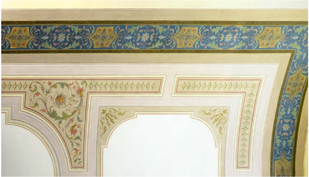
Abb. 5. Ehemalige Intendantenwohnung, großer Salon, Dekorationsmalerei von der Firma Wild & Weygand, Foto: A. Schumacher.

Wänden und Decken des wiederentdeckten Hauses des Nero, die sogenannte Domus Aurea , die man bei ihrer Auffindung mit einer Höhle verwechselte. „In den Bruchstücken römischer Architektur wurde eine neue Kombination aus gemalten Motiven ans Licht gebracht, welche in der Literatur und schließlich auch im Sprachgebrauch als Groteske bezeichnet werden. Es handelt sich hierbei um eine Vielzahl an fantastischen Darstellungen von Figuren, Amoretten, Mischwesen aus Menschen und Tieren, Sphingen und Sirenen, die in einem bizarren architektonischen Gerüst agieren, nach Art eines Kandelabers angeordnet oder in Ranken verstrickt sind. Diverse andere Motive wie naturalistische oder heraldische Tiere, Masken, Rinderschädel – auch Bukranien genannt – Girlanden oder Gebinde aus Obst, Gemüse und Blumen, Vasen, verschiedenste Trophäen und Musikinstrumente werden in diese Kulissen hineingesetzt“ (TICHY 2011: S. 6).