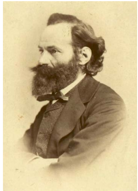
Abb. 1. Pietro Isella.

Seine Werke finden sich in der Altlerchenfelder Kirche, in der Hofoper, der Universität, dem österreichischen Museum für Kunst und Industrie, dem Parlament sowie in zahlreichen Privathäusern und Villen in der Umgebung von Wien sowie im Ausland im Tschechischen Nationaltheater. In der Hermessvilla schuf er dekorative Arbeiten für das Schlafzimmer von Kaiserin Elisabeth. In den 1990ern wurden in der Gmundner Villa Lanna Ölmalereien von Pietro Isella entdeckt (PECHBÖCK 1992; ANONYM s.d. ).