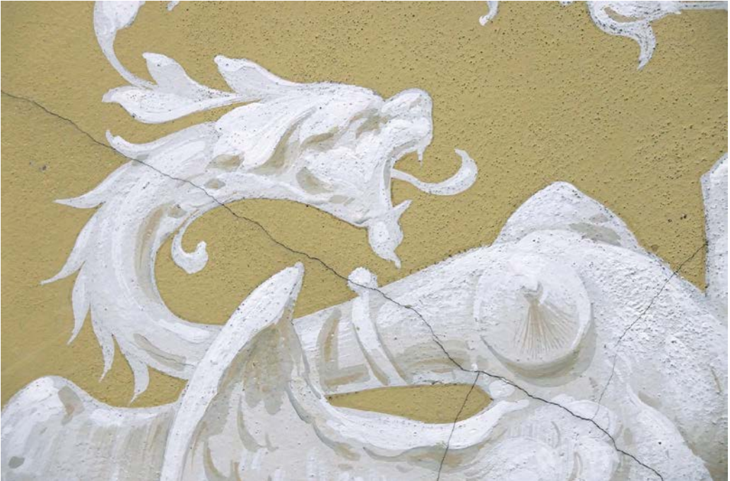
Abb. 7. Grisaillemalerei mit Spuren von einer Lochpause, Foto: Anna Boomgaarden.