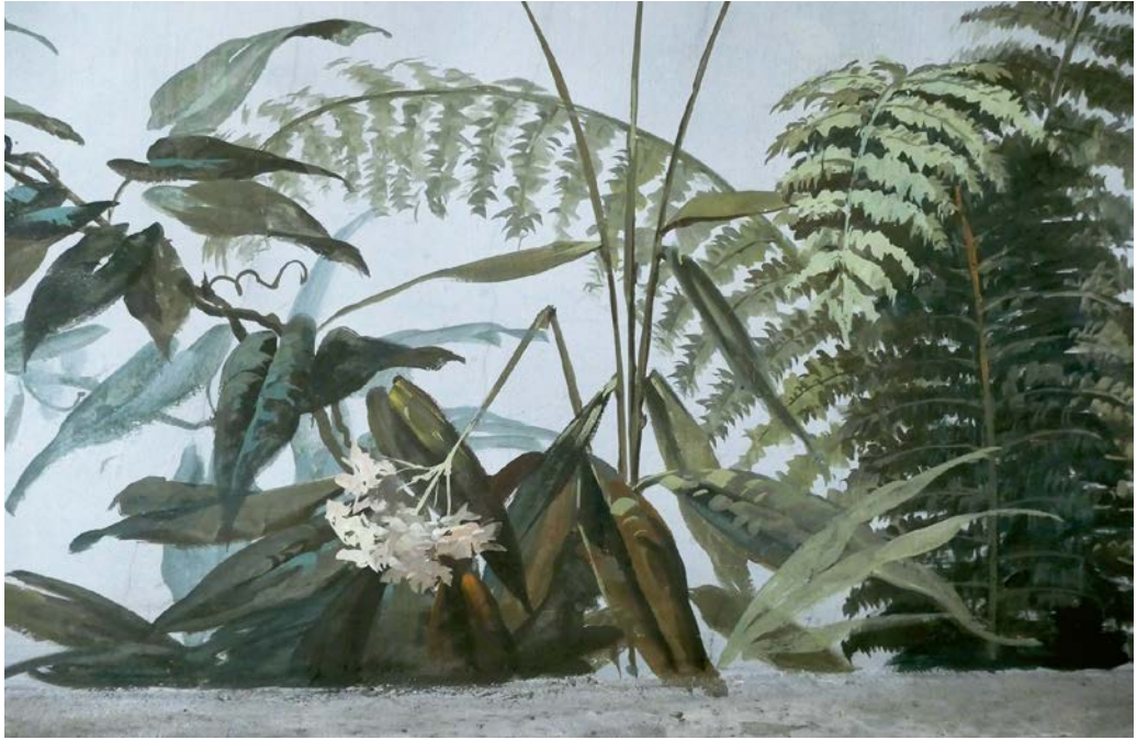
Abb. 9. Detail aus einem Lünettenfeld mit Pflanzendarstellungen, Kleine Feststiege, Foto: Anna Boomgaarden.

Freihandmanier – ohne viele Hilfsmittel – ausgeführt worden zu sein. Der Betrachter hat fast den Eindruck durch die Lünettenfelder – wie durch ein Fenster in einem Gewächshaus – auf Pflanzen und den freien Himmel zu blicken.