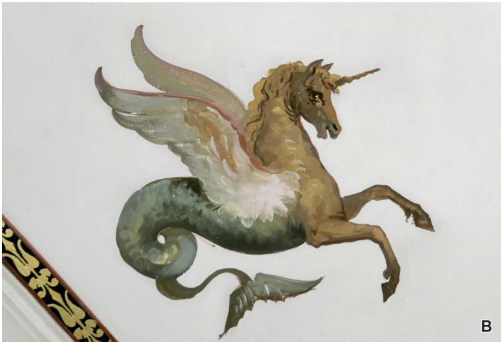
Abb. 13. Einhorn von Pietro Isella aus der Dekorationsmalerei des Saales 34 (A) und der Kleinen Feststiege (B).