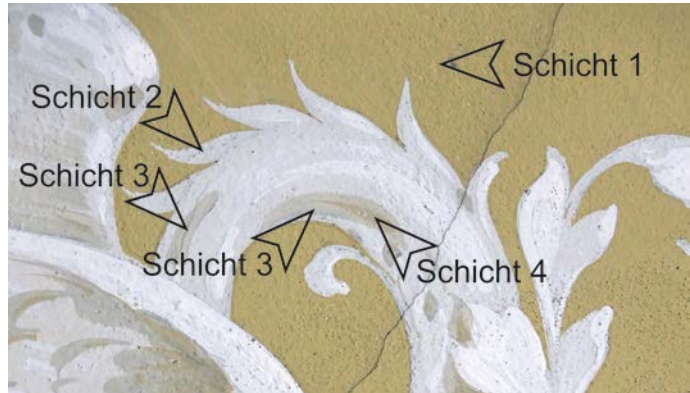
Abb. 11. Grisaille-Malerei aus den Stichkappen. Die Pfeile verweise auf die schematische Malweise mit mehreren aufeinanderfolgenden Schichten, Foto: Anna Boomgaarden.

Stichkappen der kleinen Feststiege sind stilistisch bereichsweise eher zeichnerisch angelegt. Auf einem ockerfarbenen Fondton (Schicht 1 in Abb. 11) wurden zunächst die Lochpausen verwendet, um die Formgebung abzubilden. Dann wurde der mittlere Grundfarbton (Schicht 2 in Abb. 11) des Dekors flächig angelegt. Dann folgten die Modellierungen mit Licht- und Schattenakzenten (Schicht 3 und 4 in Abb. 11). Die illusionistische Wirkung basiert dabei auf fünf aufeinander abgestimmten Weiß- bzw. Grautönen. Erhöht wird die Wirkung der Dreidimensionalität durch Schraffuren mit der Schattenfarbe. Sie ähneln denen, die sich in den Sälen des 1. Stockes über den Lünettenfeldern befinden und von Pietro Isella ausgeführt wurden. „... und auch die Arabesken auf dunklem Grunde, die die Lunettenkappen zieren ...“ verdienen Lob, hieß es in der Kunstkritik (NOSSIG 1889: 576 f.).