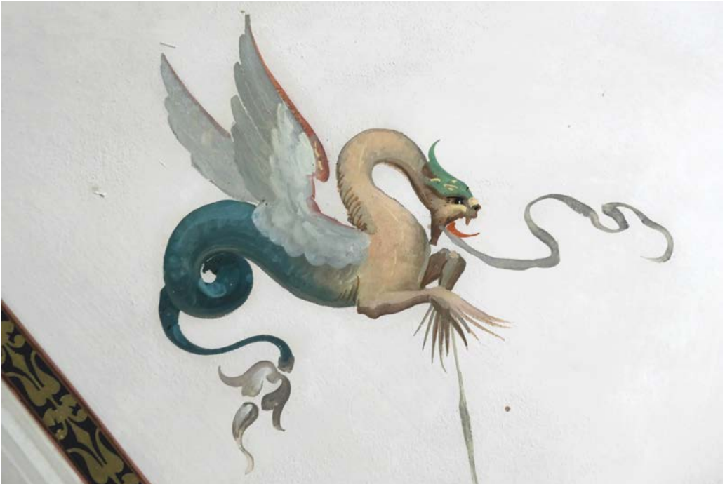
Abb. 10. Fabelwesen mit gekonnten Schraffuren, Kleines Stiegenhaus, Foto: Anna Boomgaarden.

angelegt und dann feucht modellierend mit Licht- und Schattenbereichen nachgearbeitet. Zum Abschluss wurden freihand sehr gekonnt Schraffuren – dunkle Konturen und / oder helle Lichtbereiche – aufgesetzt. Die Pinselführung bei den Schattenlinien ist dabei gut zu erkennen (Abb. 10), wohingegen bei der Modellierung der Körper die Farbtöne verschwimmend aufgebracht sind. Das luftige Erscheinungsbild der Fabelwesen erinnert dabei an farbige Aquarelle. Inwieweit Schablonen oder Pausen zum Einsatz kamen, ist derzeit ungeklärt. Mit Sicherheit gab es jedoch Vorzeichnungen zur Platzierung der Motive, andernfalls wäre keine so gleichmäßig angeordnete Bemalung möglich gewesen. Es zu vermuten, dass die Komposition mit Hilfe von Kartons und Vorzeichnungen arrangiert wurde.