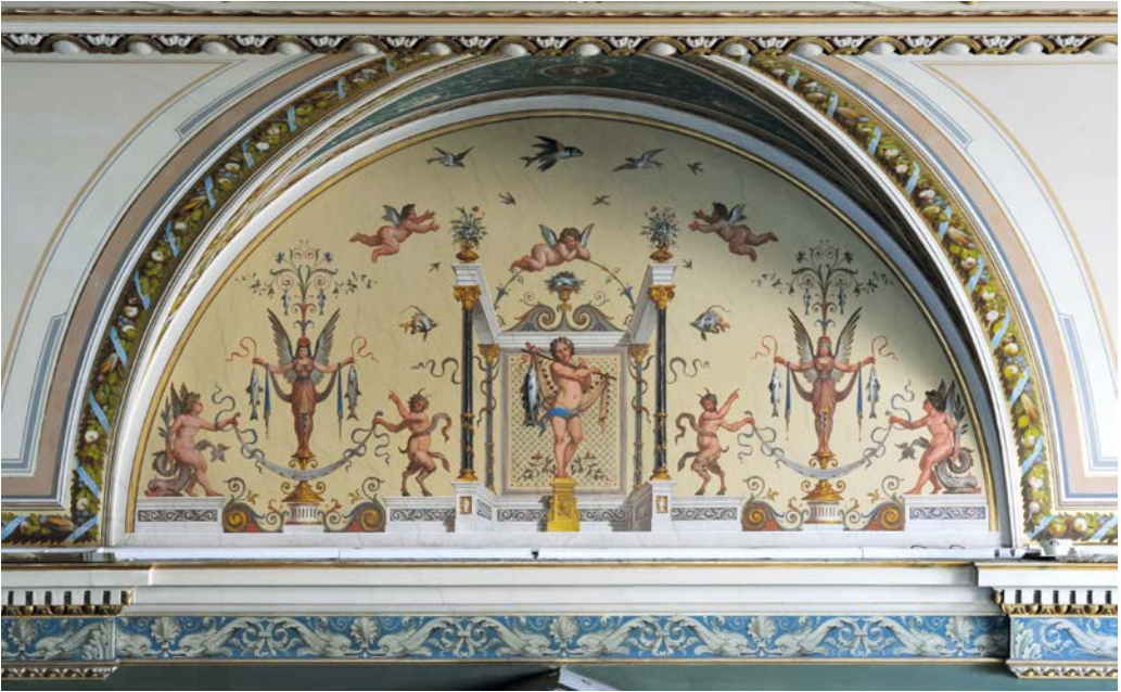
Abb. 2. Lünette, Saal 24, Pietro Isella, 1886, Foto: Alice Schumacher.

welcher die geschmackvollen ornamentalen Malereien im zweiten Stockwerke, sowie die Lunettenmalereien in den Sälen des ersten Stockwerkes ausgeführt hat und auch in den Arabesken auf dunklem Grunde, die die Lunettenkappen zieren“ (NOSSIG 1889: S. 576 f.). Die Quellen im Allgemeinen Verwaltungsarchiv bestätigen dies durch drei Hinweise auf seine Tätigkeit im Museum: Vom 23.1.1883 „Herstellung der Malereien in den Sälen“ (AT-OeStA/AVA Inneres Mdi STEF A Hofbauk. 22.19) sowie „Ausführung der Malereien in den Sälen des ersten Stockes vom 8.1.1884“ (AT-OeStA/AVA Inneres Mdi STEF A Hofbauk. 23.66) sowie vom 12.4.1884 „Ausführung der Malereien in den Korridoren des zweiten Stockes“ (AT-OeStA/AVA Inneres Mdi STEF A Hofbauk. 23.83).