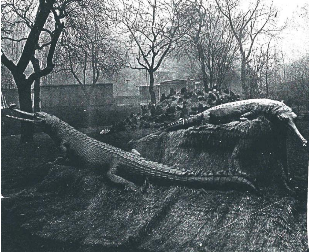
Abb. 6: Kopie eines Fotos der beiden (frisch aufgestellten?) Gangesgaviale, das den Lebenserinnerungen Johannes Umlauffs im Hagenbeck-Archiv in Hamburg beiliegt. Das Foto entstand vermutlich vor 1902, der Ort der Aufnahme ist unbekannt.