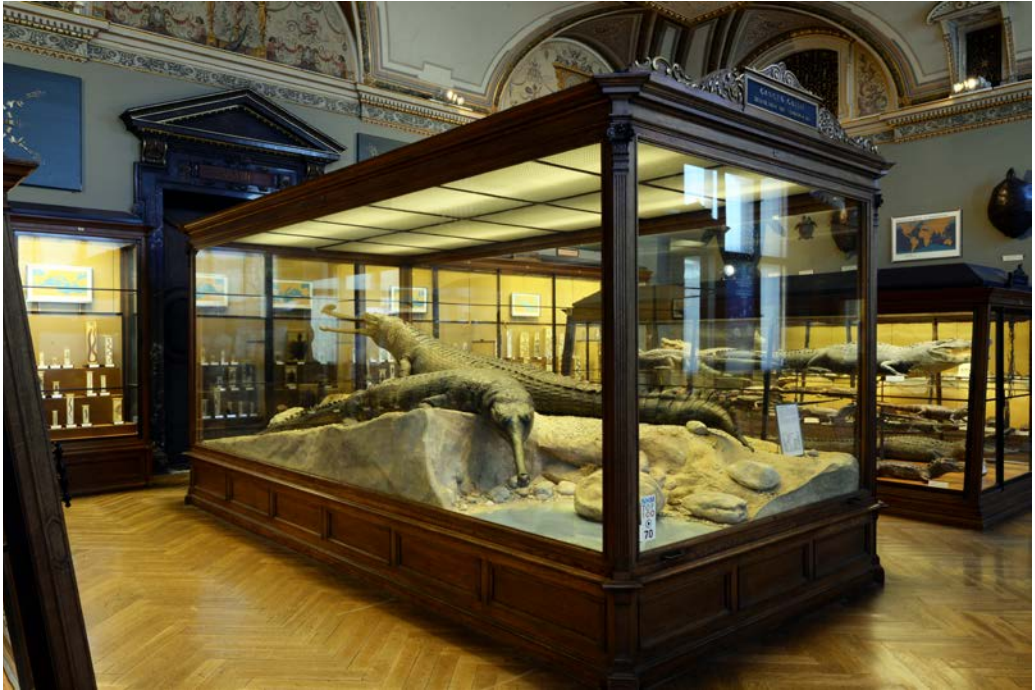
Abb. 2: Die beiden großen Gangesgaviale im Saal XXVIII des Naturhistorischen Museums Wien gehören zu den beeindruckendsten Exponaten der Reptilien- und Amphibien-Ausstellung. Über ihre Herkunft war bisher nur sehr wenig bekannt.