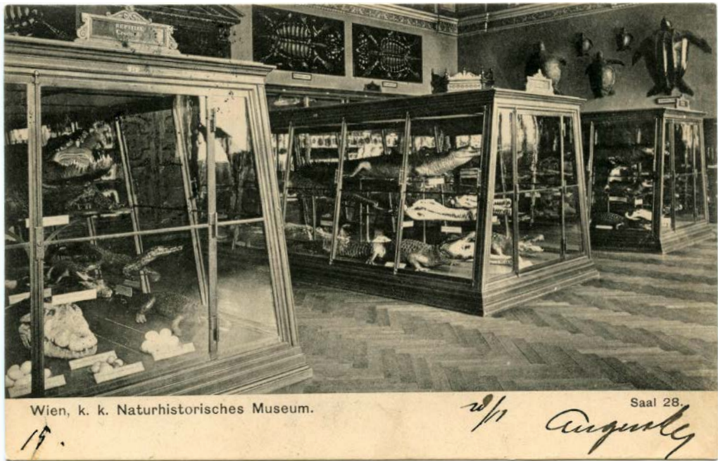
Abb. 3: Das historische Postkartenfoto zeigt Saal XXVIII des Naturhistorischen Museums vor der Aufstellung der zwei großen Gangesgaviale, die irgendwann nach 1904 erfolgte. Für die Zurschaustellung der beiden außergewöhnlichen Krokodile wurde die mittlere Vitrine, die im oberen Bereich bereits ein älteres Gavialpräparat enthielt, durch eine größere ausgetauscht.