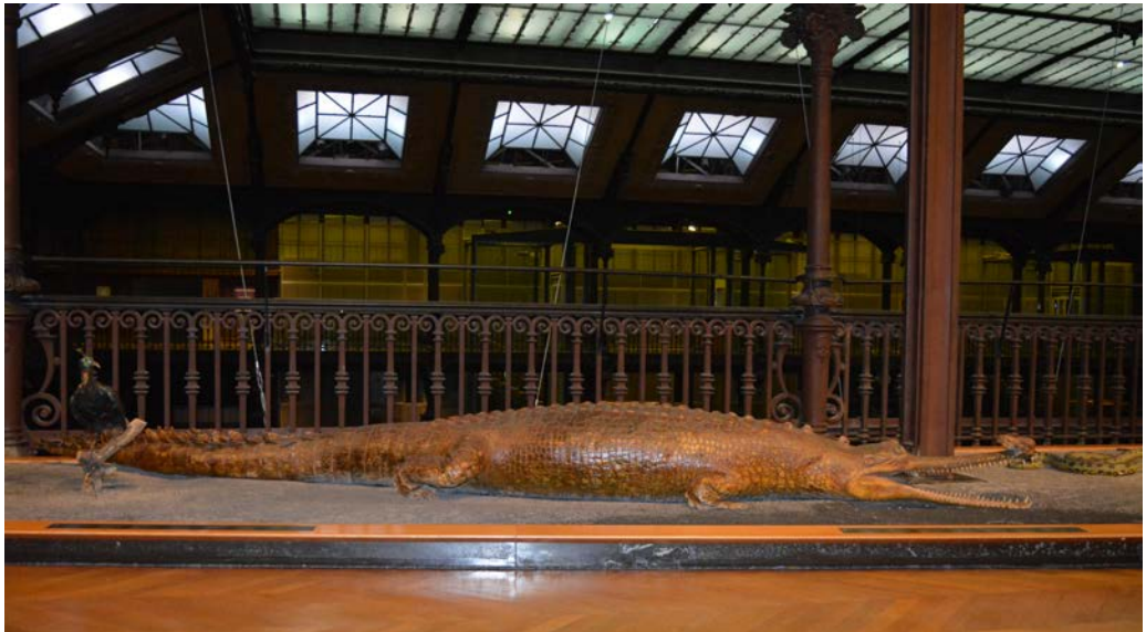
Abb. 8: Der größte Gangesgavial (MNHN-RA-0.7581) im Muséum National d'Histoire Naturelle in Paris stammt aus der ersten Hälfte des 19. Jahrhunderts und soll ursprünglich 5,40 Meter lang gewesen sein. Da die Schwanzspitze fehlt, misst das Präparat heute nur noch 5,15 Meter.

10 Jahren zwischen etwa 1893 und 1902 geschah, nachdem sie aus Südasien nach Hamburg gelangt waren? Wurden sie sogleich präpariert und in Umlauffs eigenem Handelsmuseum ausgestellt? Oder erwarb Carl Hagenbeck sie bereits kurz nach der Präparation und stellte sie selbst in den Räumlichkeiten seiner Tierhandlung und/oder während der seit 1878 an wechselnden Orten stattfindenden Reptilienschauen aus? Hierzu könnten weiterführende Recherchen im Hagenbeck-Archiv in Hamburg oder in historischen Zeitungen der Hansestadt und andernorts eventuell Antworten liefern.