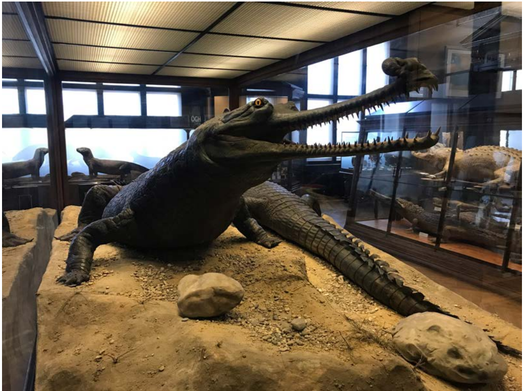
Abb. 1: Porträt des 5,43 Meter langen, männlichen Gangesgavials mit der typisch wulstigen Aufwölbung auf der Schnauzenspitze. Neben diesen Krokodilen wirkt der Komodowaran ( Varanus komodoensis ) im Hintergrund wenig beeindruckend.

1912). Anlässlich des zweiten Besuchs von Kaiser Franz Joseph I. (1830–1916) im k. u. k. naturhistorischen Hofmuseum am 28. Februar 1905 schrieb Franz Steindachner (1834–1919), der damalige Intendant (Direktor) des Museums, in seinem Jahresbericht, dass „Anlaß dazu (...) die Besichtigung einiger bedeutenden Erwerbungen des Hofmuseums aus jüngster Zeit [bot].“ So wurde nach dem feierlichen Empfang des Kaisers zunächst das Oktagon des ersten Stockwerkes aufgesucht, wo die neuesten „ethnographischen und sonstigen Sammelergebnisse (...) zur temporären Ausstellung gebracht waren. Im Anschlusse daran wurde auch die daselbst aufgestellte große Gavialgruppe, ein Geschenk des Hofrates Steindachner, besichtigt“ (STEINDACHNER 1906).