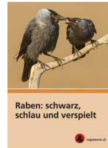
Die Broschüre ist bei der Schweizerischen Vogelwarte erhältlich. Link: https://www.vogelwarte.ch/de/shop/broschueren/raben-schwarz-schlau-und-verspielt

»Interessanterweise sind Rabenvögel ebenfalls Singvögel – wenn auch keine sehr musikalischen«, schmunzelt Vogel. Rabenvögel sind sehr intelligent und anpassungsfähig. Sie haben es geschafft, sich in einer von Menschen dominierten Landschaft zurechtzufinden. Mit einem besseren Verständnis für Ökologie und Verhalten der cleveren Tiere können viele Konflikte entschärft werden.