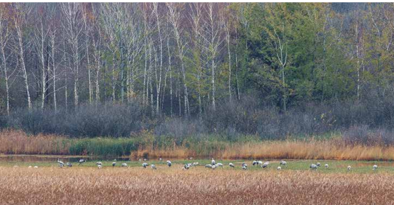
Am 24. 11. 2019 hielten sich 39 Kraniche im Schilfgürtel (gemähter und überfluteter Teil) des Kalterer Sees auf.