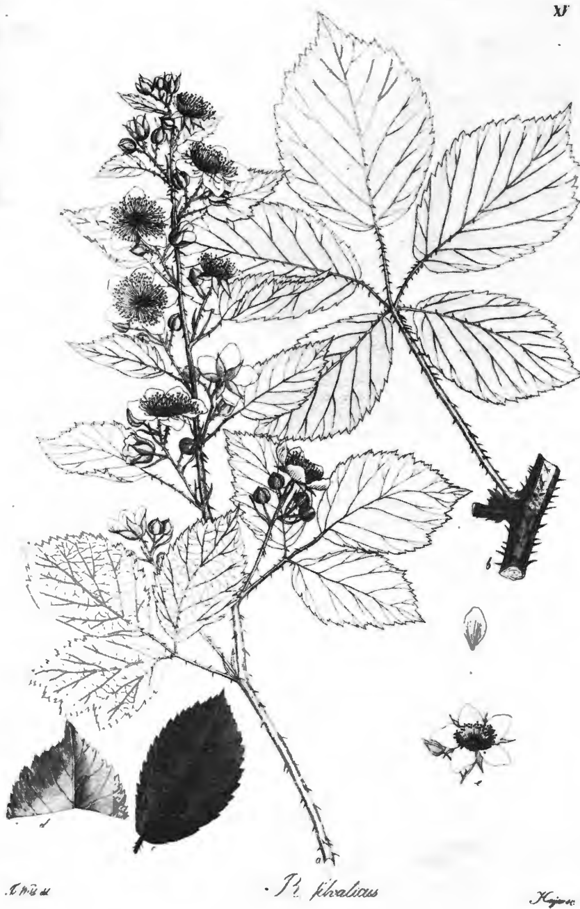
Abb. 9: Kupfertafel zu Rubus silvaticus aus „Rubi germanici“.

an; bei abwechselnden Arten folgt eine Aufzählung der Varietäten mit ihren Merkmalen. Den Hauptteil jedes Textes mit durchschnittlich einer Seite Umfang nimmt die eigentliche Beschreibung der Art ein, die jeweils mit einigen Angaben zur Verbreitung abschließt. Blätter, Stengelstücke und Blütenstände sind mit den