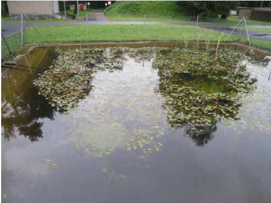
Abb. 1: Feuerlöschteich auf dem MZB-Gelände mit Schwimmendem Laichkraut ( Potamogeton natans ) - Blick von Osten auf das Gewässer.