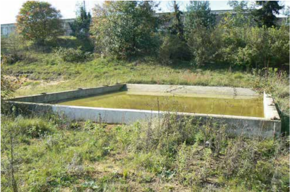
Abb. 3: Betonwanne auf dem Gelände der Freiherr-vom-Stein-Kaserne, Coesfeld.