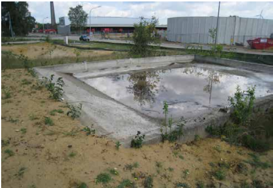
Abb. 4: Betonwanne auf dem Gelände der Freiherr-vom-Stein-Kaserne. Linksseitig ist die nachträglich eingebrachte flache Betonrampung gut zu erkennen.