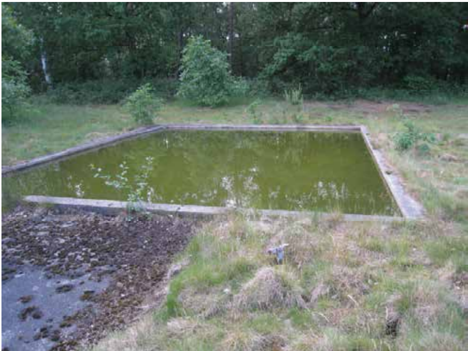
Abb. 2: Betonwanne auf dem Gelände der Barbarakaserne, Dülmen.

Aufgrund der fehlenden Überdachungen sammelt sich in diesen Wannern Nie-derschlagswasser. Der wechselnde Wasserstand ist abhängig von Nieder-schlagsmengen, Temperaturen und Verdunstung. Durch Falllaubeintrag und durch Windeinwehungen wird organisches und anorganisches Material in die Wannern eingebracht und bildet Nahrungsgrundlage für ein teilweise intensives Algenwachstum. Höheres Pflanzenwachstum (Laichkräuter, Röhricht) fehlt, ebenso Uferhochstauden und Ufergehölze.