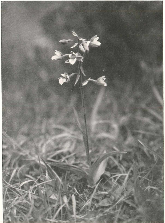
Epipactis palustris (in der Sumpfwiese).