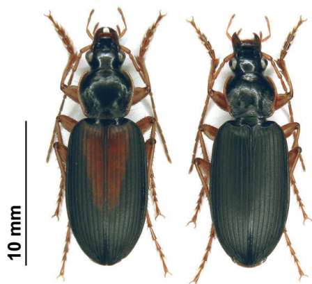
Sl. 1: Svetla in temna oblika vrste Dolichus halensis . Slednja je v Sloveniji glede na pričujočo raziskavo redkejša in predstavlja zgolj 22 % populacije.

spreminjalo ( \chi^2=0,2 , ns). Delež svežih osebkov se verjetno proti koncu poletja in jeseni zmanjša, saj se sezona aktivnosti odraslih hroščev prične v začetku julija (Marggi, 1992).