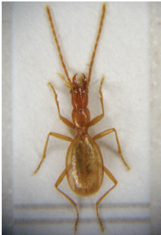
Sl. 2: Orotrechus koflerianus (naravnostna velikost: 4,1 – 4,2mm).

ka; 11. 7. – 28. 9. 1997: 2 osebkov; 28. 9. 1997 – 16. 5. 1998: 5 osebkov; 16. 5. – 18. 9. 1998: 5 osebkov; 18. 9. 1998 – 12. 6. 1999: 2 osebkov; 12. 6. – 22. 8. 1999: 5 osebkov; 22. 8. 1999 – 27. 5. 2000: 5 osebkov; 27. 5. – 11. 8. 2000: 5 osebkov; 26. 5. – 15. 9. 2001: 1 osebek; 24. 7. 2004 – 21. 5. 2005: 5 osebkov; 21. 5. – 25. 8. 2005: 5 osebkov; 25. 8. 2005 – 9. 7. 2006: 2 osebkov, vse B. Kofler leg.