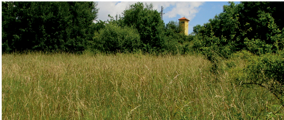
Sl. 1: Biotop vrste Ptilocephala muscella v Križevcih

Ž. Predovnik: Ptilocephala muscella ([Denis & Schiffermüller], 1775) prvič najdena v Sloveniji (Lepidoptera: Psychidae)