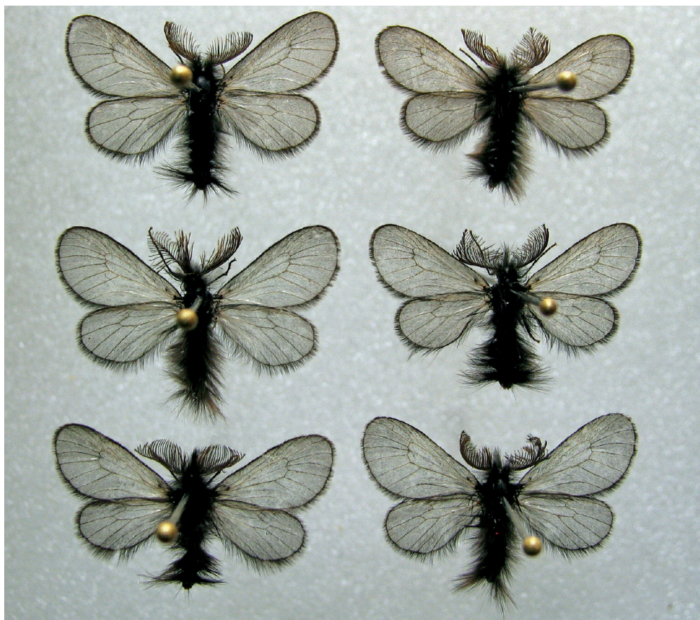
Sl. 2: Samčki vrste Ptilocephala muscella iz Križevcev