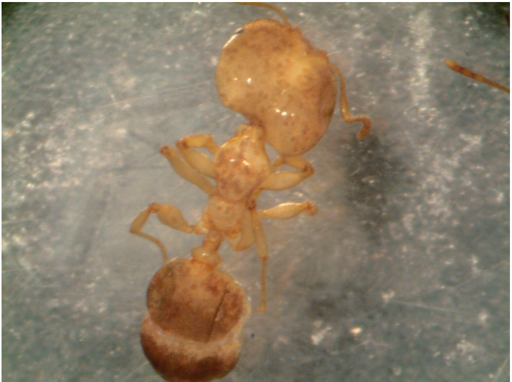
Fig. 1. Pheidole pallidula (Nylander) major worker from Koper (Slovenia) infested with spores of Myrmecinosporidium durum Hölldobler.

The spores were detected in a lightly coloured major worker of Pheidole pallidula (Nylander, 1849) foraging out of the nest (Figs. 1, 2). Three minors and one major were also collected, but were not infested. The nest was in a crack at the base of stairs in