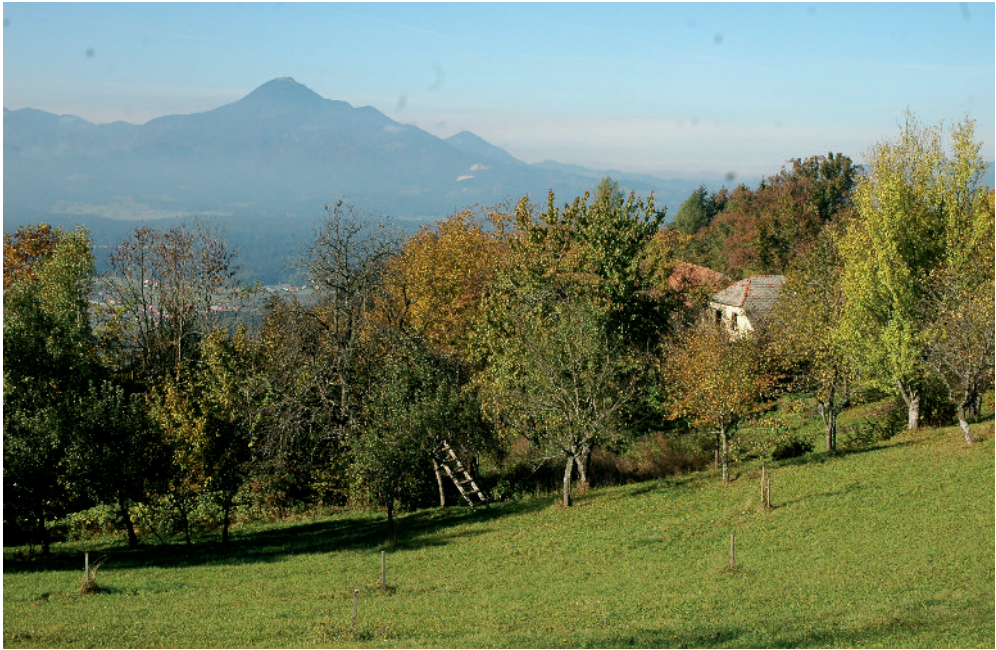
Sl. 2: Lokacija najdbe Spoladea recurvalis na Brdah na Pohorju, kjer je vrsta zabeležena 16. 11. 2014. V ospredju travnik in sadovnjak.

Odrasli osebki imajo premer sprednjih kril od 22 do 24 mm. So čokoladno rjave barve in imajo na sprednjih krilih po dve, na zadnjih pa po eno belo prečno liso (Slika 1). Letajo od maja do septembra, odvisno od lokacije. Gosenice so polifage in se hranijo z različnimi kulturnimi rastlinami, kot so špinača ( Spinacia ), pesa ( Beta ), bombaž ( Gossypium ), koruza ( Zea ), soja ( Glycina ), ščir ( Amaranthus ) in tolščak ( Portulaca ). V naravi se hranijo z različnimi divjimi rastlinami. Gosenice so zelenkaste barve in odrasle merijo okrog 19 mm. Zabubijo se v rahlem zapredku v zapognjenem delu lista. Bube so svetlo rjave barve. Metulji se v tropskem podnebjju izležejo v 10 do 12 dneh (Wikipedia 2015).