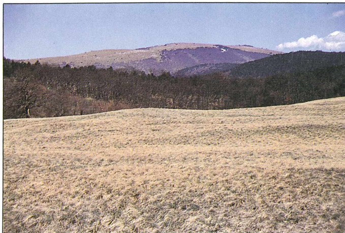
Sl. 1: Vremščica z jugozahoda, izpred gradu Školj.

Fig. 1: Vremščica from the southwest, from the castle Školj.