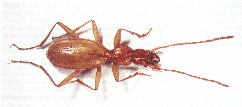
Sl. 3: Anophthalmus kofleri Daffner 1996