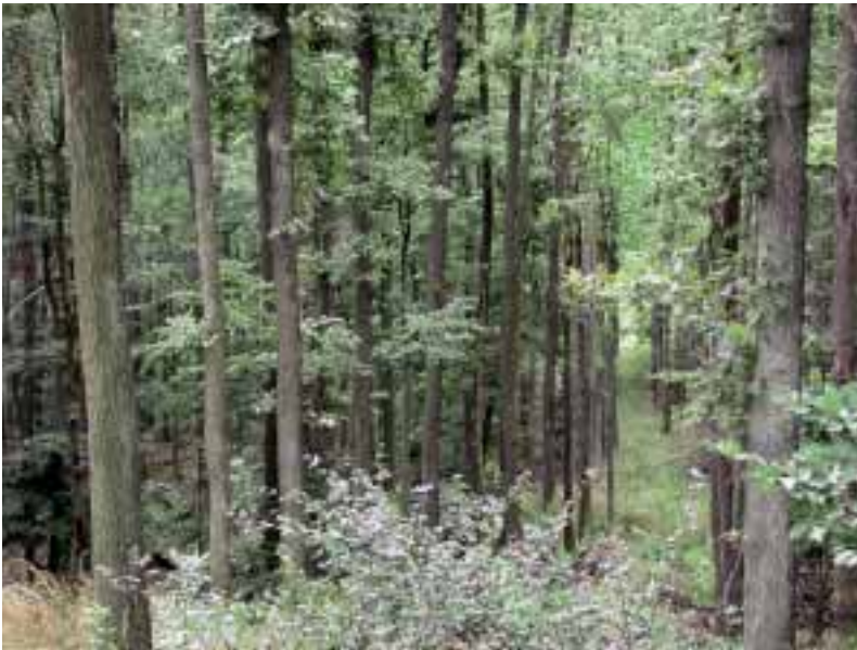
Abbildung 9: Der Eichenschälwald in der Waldabteilung Heineberg am Oestheimer Berg diente der Gewinnung von Gerberlohe.

Figure 9: The oak forest in the forest section Heineberg at the Oestheimer Berg served for the production of tanbark.