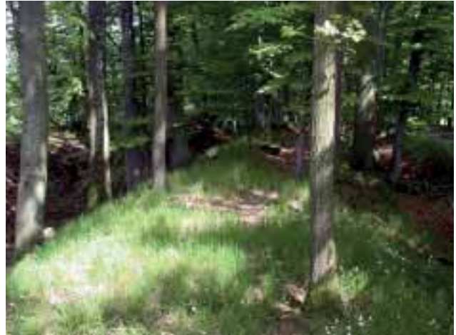
Abbildung 7: Erhaltener Abschnitt der Landhege bei Großharbach im Landkreis Ansbach, der sich als Gehölzgürtel durch die Landschaft zieht.

Rothenburg ob der Tauber und das die alte Reichsstadt umgebende Landgebiet vermitteln noch sehr gut das Leben und Wirtschaften der vorausgegangenen Generationen. Das Kernstück des Rothen-