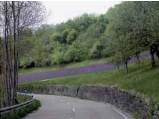
Abbildung 1: Die Romantische Straße – einer der ältesten und bekanntesten Ferienstraßen Deutschlands – als Rückgrat des Taubertals.

Figure 1: The romantic road – one of Germany's oldest and most well-known holiday roads – as the backbone of the Tauber Valley.