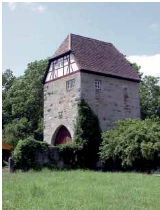
Abbildung 6: Landturm bei Oberrimbach-Lichtel im Main-Tauber-Kreis (Baden-Württemberg). Aufnahme Thomas Büttner, LfU 2007

Im Laufe des 17. Jahrhunderts wurden Hegesteine als Grenzmarkierungen gesetzt. So entwickelte sich die Landhege Ende des 17. Jahrhunderts von einer Wehrgrenze zu einer Rechts- und Zollgrenze. Im 18. Jahrhundert schließlich hatten Teile der Landhege die Funktion einer Wildbannngrenze inne und bildete somit die Außengrenze eines herrschaftlichen Jagd- und Forstbezirks. Mit dem Verlust der Reichsunmittelbarkeit – des landeshoheitlichen Stellung Rothenburgs – verlor die Landhege ihre Funktion, weite Teile wurden eingeebnet, die zur Landhege gehörenden Ländereien verkauft. 7)