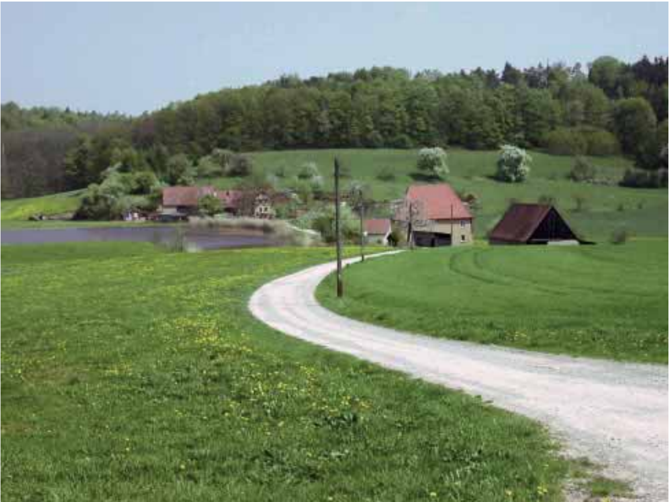
Abbildung 11: Karrach-Mühle und Karrachseen im Landkreis Ansbach. Der Mühlbetrieb und die Fischzucht nahmen eine besondere wirtschaftliche Bedeutung im Rothenburger Landgebiet ein

Figure 11: Karrach mill and Karrach lakes in the district of Ansbach. The operation of the mill and fish farming had a special economic importance in the rural areas around Rothenburg