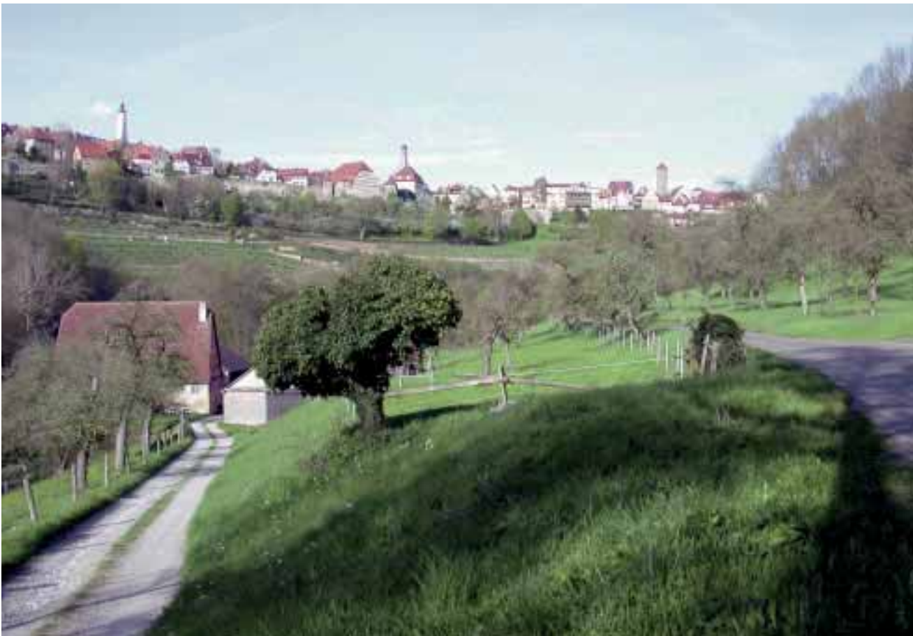
Abbildung 3: Blick über die Lukasrödermühle auf Rothenburg ob der Tauber. Zu Füßen der Stadt Rothenburg wurde der Weinbau in den vergangenen Jahren wieder belebt.

Figure 3: View over the mill Lukasrödermühle of Rothenburg. At the gates to the city of Rothenburg viticulture was revived in the past years.