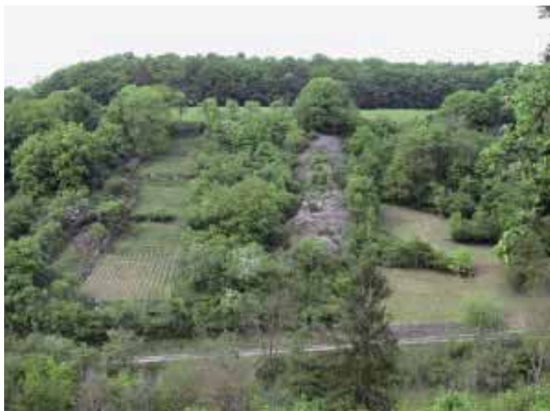
Figure 10: Old vineyard with ridges of collected stones and dry stone walls between Tauberzell and Neustett (district of Ansbach). Photo: Thomas Büttner, LfU 2007

Abbildung 10: Alter Weinberg mit Lesesteinriegeln und Trockenmauern zwischen Tauberzell und Neustett (Landkreis Ansbach). Aufnahme Thomas Büttner, LfU 2007