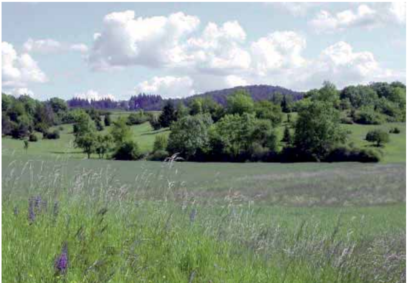
Abbildung 8: Kirnberger Hutung im Landkreis Ansbach als Zeugnis der historischen Landnutzung. Die Schafhaltung besaß einst große wirtschaftliche Bedeutung im Rothenburger Landgebiet

burger Landgebiets bildet das Taubertal, das sich tief in den Muschelkalk eingeschnitten hat. Über dem Steilabfall zur Tauber gelegen, beherrschen die ein-