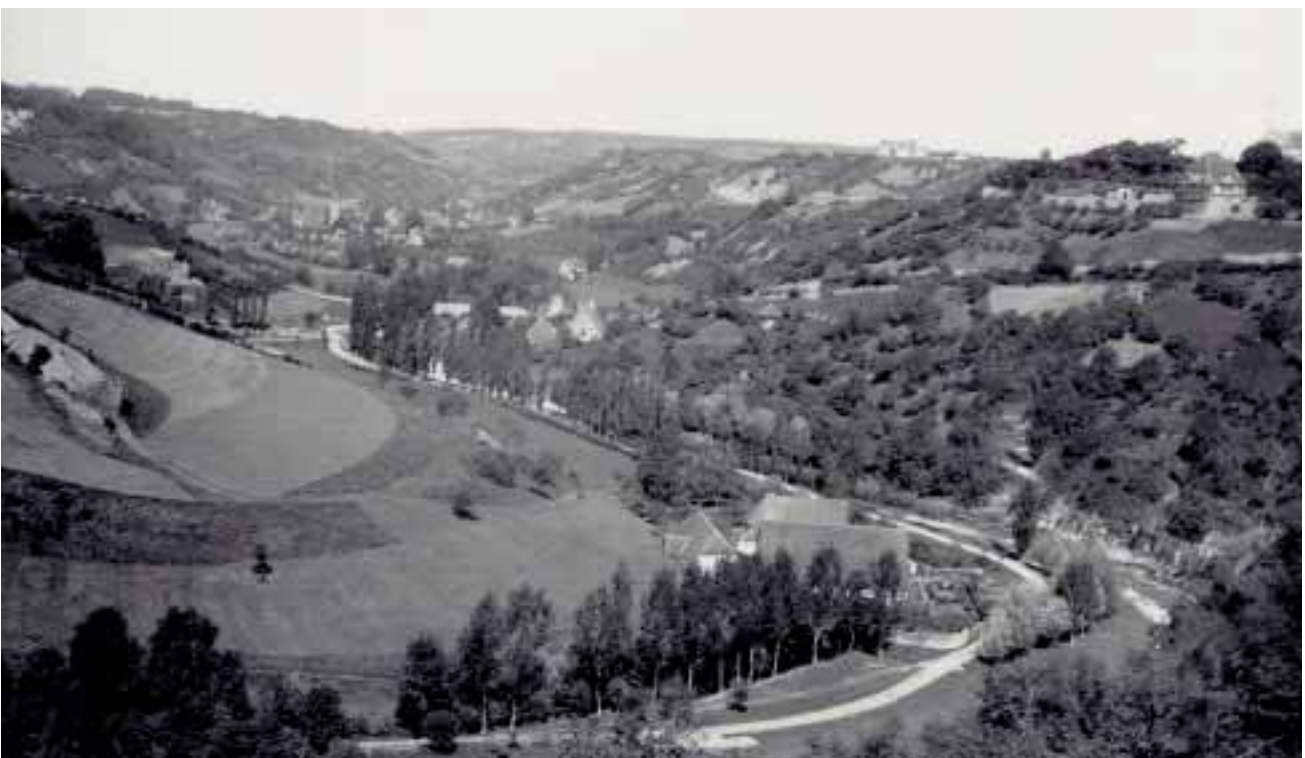
Abbildung 2: Historische Aufnahme von dem oberen Taubertal zwischen Rothenburg o.d.T. und Detwang an der Wende zum 20. Jahrhundert. Deutlich erkennbar sind die Lesesteinriegel als Zeugnisse des historischen Weinbaus.

Wer sich eingehender mit der Geschichte der Stadt Rothenburg befasst, der wagt schnell den Schritt aus dem Taubertal hinaus in die Hochlagen des Rothenburger Umlands, dem Landgebiet der einstigen Reichsstadt Rothenburg. Dieser Landstrich steckt voller Geschichte, ist überaus reich mit Natur- und Kulturdenkmälern ausgestattet. Um dem wechselseitigen Verhältnis von der Naturvorgabe und der Kulturleistung der vorausgegangenen Generationen nachzuspüren, rief das Bayerische Landesamt für Umwelt im Frühjahr 2006 das Vorhaben „Rothenburg ob der Tauber und sein reichsstädtisches Landgebiet – kulturhistorische Charakterisierung einer grenzüberschreitenden Kulturlandschaft“ ins Leben.