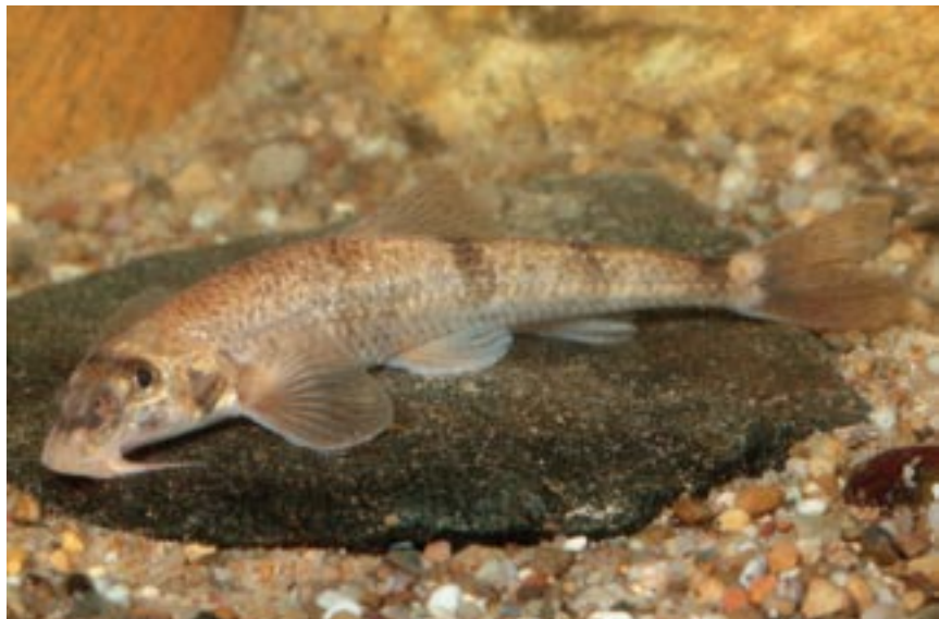
Abbildung 2: 12,2 cm langer Steingressling aus dem Lech

Obwohl verschiedene Fachautoren teils unterschiedliche Angaben zur Eindeutigkeit einzelner Merkmale machen, ist der Steingressling optisch gut von den anderen im bayerischen Donaauraum vorkommenden Gründlingsarten unterscheidbar. Als artspezifische Merkmale des Steingresslings gelten die sehr langen Bartfäden, die zurückgelegt bis über den Augenhinterrand hinausreichen sowie eine beschuppte Kehle. Letztere ist bei einem österreichischen Lokalvorkommen jedoch nicht vorhanden (vergleiche HAUER 2007). Charakteristisch ist der schlanke und besonders am langen, vergleichsweise dünnen Schwanzstiel drehrunde Körperbau. Auffällig sind auch die gegenüber anderen Gründlingsarten deutlich vergrößerten Brustflossen sowie die längere, spitze Schnauze. Die Farbgebung kann stark variieren, wobei auf dem Rücken bis zu fünf dunkle Sattelbinden erkennbar sind. Bei den Exemplaren aus dem Lech treten drei bis vier Sattelbinden, die hinter der Rückenflosse folgen, optisch besonders gut hervor. Schließlich zeigt sich in der Draufsicht das namensgebende Merkmal: Auf dem etwas abgeflachten Kopf sind die Augen leicht schräg nach oben gerichtet und durch eine maskenartige, dunkle Querbinde markant abgesetzt. So ist der Artnamen „ uranoscopus “ griechischen Ursprungs und aus