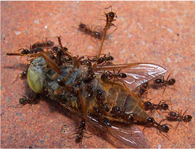
Die Argentinische Ameise ( Linepithema humile ) ist eine invasive Insektenart, die sich auch in wärmebegünstigten Bereichen Mitteleuropas ansiedeln kann (Foto: Álvaro Rodríguez Alberich, Wikimedia; CC BY-SA 2.0).