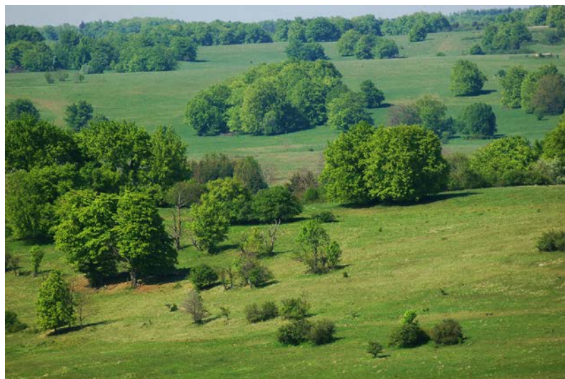
Landschaften mit viel Grünland sind inzwischen selten. In Deutschland ist der Rückgang des Grünlandes und seiner Arten auch im Zeitraum zwischen 2009 und 2013 deutlich.

Zentrale Rolle spielt dabei eine effiziente Ausgestaltung der Agrar-Umweltmaßnahmen und der Gemeinsamen Agrarpolitik (GAP) der EU. Neben verbesserten Förderbedingungen für von Beweidung abhängigen Grünlandtypen und Saumstrukturen müssen Agrarumweltmaßnahmen besonders honoriert werden, die einen echten Mehrwert für die biologische Vielfalt haben. Staatliche Zahlungen sollten stärker an positive Wirkungen für das Grünland mit hohem Naturwert ge-