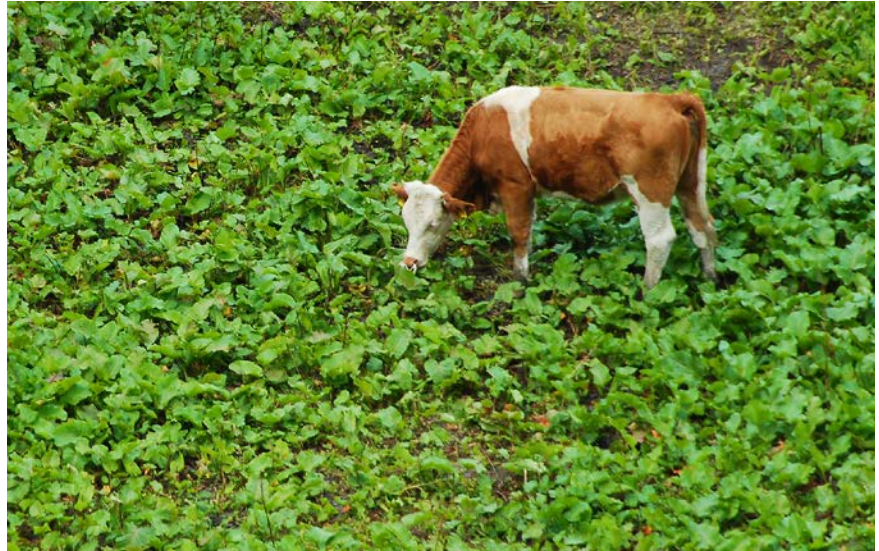
Durch Verbiss großwüchsiger Pflanzenarten kann Beweidung die biologische Vielfalt gedüngter Wiesen stabilisieren.

Die Autoren führen den Effekt darauf zurück, dass die Tiere die hochwüchsigen Pflanzen abweiden. Somit bekommen niedrigwüchsigerer Pflanzenarten trotz hohem Nährstoffangebot ausreichend Licht, um überleben zu können. Dabei wird