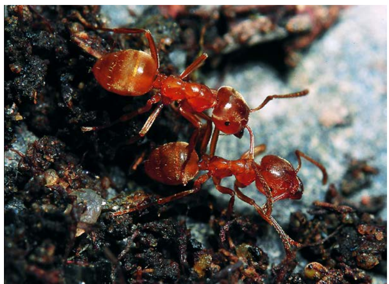
Erdameisen rund um Lasius flavus bilden eine Artengruppe von 20 Arten, die effektiv anhand ausschließlich morphologischer Merkmale getrennt werden kann. Dies eröffnet Alternativen zu genetischen Untersuchungen.

SEIFERT, B., RITZ, M. & CSÖSZ, S. (2013): Application of Exploratory Data Analyses opens a new perspective in morphology-based alpha-taxonomy of eusocial organisms. – Myrmecological News 19: 1–15; http://real.mtak.hu/9768/1/mn19_1-15_non-printable.pdf .