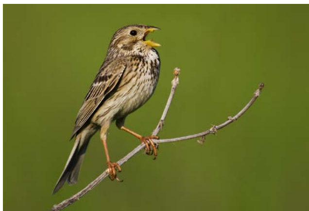
Die Grauammer ( Emberiza calandra ) ist ein typischer Vogel der Feldflur mit eingestreuten Gehölzen. In Zentralitalien ist sie ein Charaktervogel für wertvolles Agrarland.

(AZ) Untersuchungen aus Italien zeigen, dass wertvolle Agrarlandschaften anhand weniger Vogelarten mit geringem Aufwand schnell und einfach erhoben und beurteilt werden können. Damit ist ein großflächiges Monitoring der Entwicklung der Agrarlandschaft möglich.