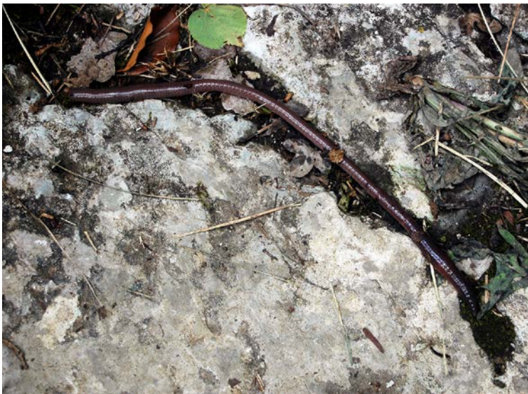
Indem Regenwürmer die Wasseraufnahme in den Boden verbessern, helfen sie, nach Starkregen Hochwasser zu verhindern.

In der Praxis bedeuten die Ergebnisse, dass durch artenreiches Grünland und eine gezielte Förderung der Bodenfauna vorbeugender Hochwasserschutz betrieben werden kann.