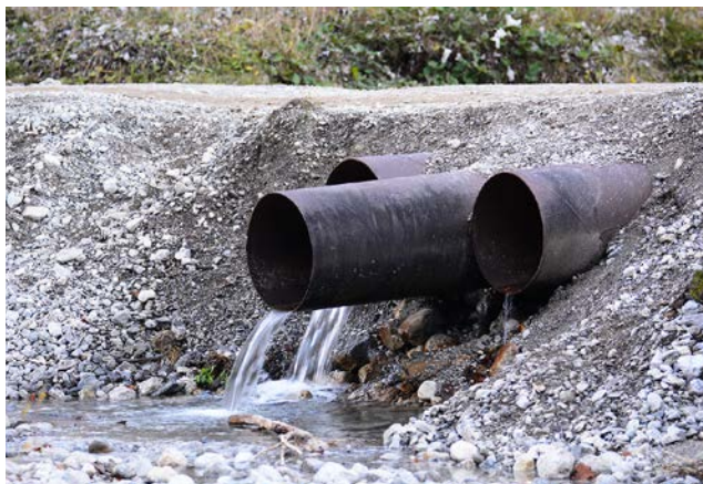
Mit einer einfachen Kartieranleitung kann festgestellt werden, ob Durchlässe kleiner Fließgewässer ein Durchgängigkeitshindernis darstellen.

(AZ) Wenn Fließgewässer Wege kreuzen, kann die ökologische Durchlässigkeit für Fließgewässer-Lebewesen deutlich eingeschränkt sein. Es wird eine einfache Möglichkeit vorgestellt, wie Probleme erkannt und gelöst werden können.