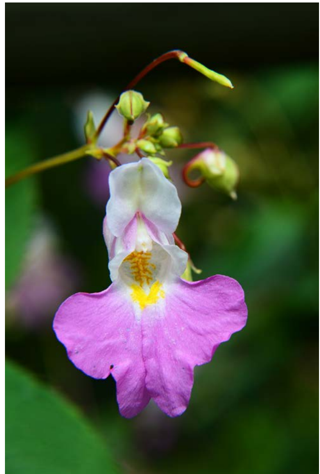
Balfour-Springkraut ( Impatiens balfourii ), ein Beispiel für eine Art, die regional in Deutschland aktuell in der Etablierungsphase ist.

Erhaltungszustand gemäß den Richtlinien 92/43/EWG (FFH-Richtlinie) und 2009/147/EG (Vogelschutzrichtlinie) sichern oder wiederherstellen.