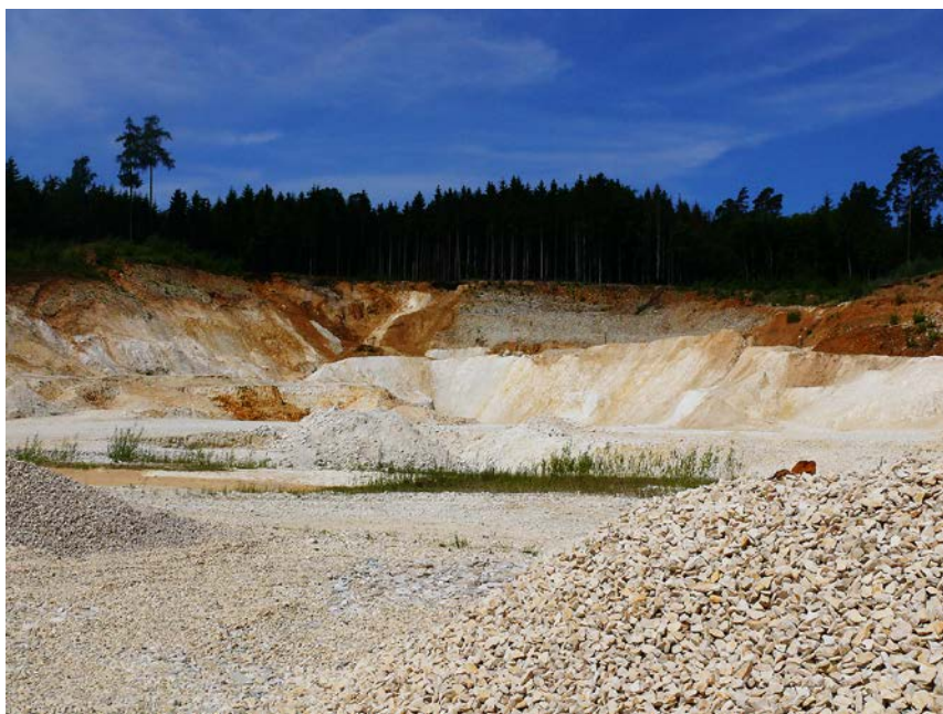
Abb. 4: Die Kieselerde-Tagebaue (Schaflache Ost) zeichnen sich aus durch: Hohe Sonneneinstrahlung, kaum Pflanzenbewuchs, sandige bis tonige Sedimente und mit natürlichen Schwebstoffen getrübe Grubenwässer.

Da die Laufzeit der Tagebaue aufgrund der geringen Größe der Lagerstätten relativ gering ist (3 bis 20 Jahre), orientieren sich die Fördermaßnahmen vor allem an der Anlage von Wanderbiotopen. Potenzielle Stellen dafür sind die Halden (Hänge, Plateaus und Basisflächen), die