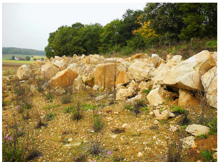
Abb. 9: Steinhalde auf einer stark sandigen Rohbodenfläche im Tagebau Riedensheim 3 als Lebensraum für Zauneidechsen.

Der laufende Abbau und das Lebensraum-Management erfordern eine dynamische Abstimmung und Anpassung. Dazu gehört eine jährliche gemeinsame Besichtigung der Tagebaue durch Betreiber und Naturschutz im Frühjahr (vor der Wander- und Laichzeit der Amphibien). Dabei werden die Belange des Artenschutzes mit den betriebswirtschaftlichen und abbautechnischen Faktoren abgestimmt. Auch die Sicherheit spielt eine wichtige Rolle, denn geänderte Abbauverhältnisse durch Maßnahmen für den Naturschutz sollten keineswegs ein Sicherheitsrisiko für die Beschäftigten im Tagebau darstellen (zum Beispiel exponierte Steine in der Böschung, Wasserflächen im oberen Grubenbereich, größere Wasserflächen zu nahe an Fahrwegen). Bei diesem Termin werden der weitere Abbaufortschritt besprochen sowie konkrete Maßnahmen für den Artenschutz objektspezifisch festgelegt.