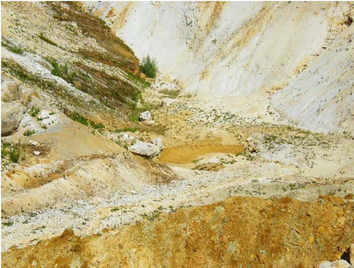
Abb. 2: Dynamische Strukturen innerhalb von Tagebauflächen ähneln stark den Strukturen naturbelassener Flusstäler mit immer wieder trocken fallenden Bereichen, unterschiedlichen Boden-Korngrößen und Sukzessionsständen.

Fig. 2: Dynamic structures in opencast mining pits are very similar to structures found in natural, undisturbed river valleys, with areas that dry out regularly, varying soil particle sizes and successional stands.