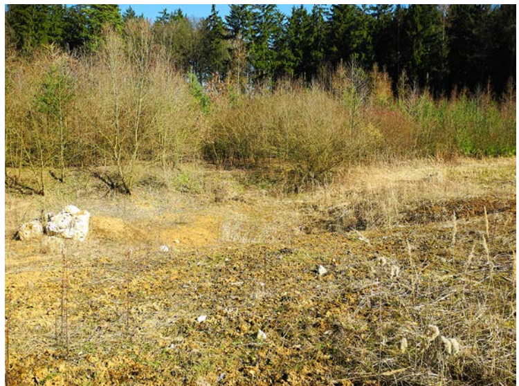
Abb. 1: Eine gut gemeinte Artenhilfsmaßnahme ohne Berücksichtigung der Standortbedingungen: Die gewünschte Wasserfläche der Abgrabung blieb aus, da nach der Rekultivierung das Wasser im durchlässigen Boden versickerte. Auch eine nachträglich aufgebrachte Lehmschicht und zusätzliche Verdichtungsmaßnahmen brachten nicht den gewünschten Erfolg. Hier wäre es besser gewesen, bestehende Strukturen – möglichst auch während der Rekultivierung – zu belassen.

In Deutschland sind dynamische und vom Menschen unberührte Lebensräume selten geworden. Lebensräume wie Gesteins- und Blockschutthalden, (Kalk-)Magerrasen, trockene Sandheiden, nährstoffarme, stehende Gewässer und vor allem natürliche Flusslandschaften werden immer weiter verdrängt oder beeinträchtigt. Steinbrüche und Tagebaue können für einige bedrohte Arten teilweisen Ersatz bieten. Bestimmte Lebensräume können sich auf den rekultivierten Flächen und während des Abbaus sekundär bilden (FETZ 2005; GLANDT 2006). Dabei kann mit geringem zielgerichteten Aufwand ein hoher Nutzen für den Arten- und Naturschutz entstehen. Unsere Erfahrungen zeigen, dass selbst ohne zielgerichtet gestaltende Maßnahmen Abbaustätten einen großen