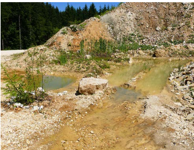
Abb. 6: Typischer Gelbbauchunken-Lebensraum: Mit Regenwasser gefüllte Fahrspuren von Tagebaufahrzeugen (SCHAILE 2014). Das Entstehen derartiger Kleingewässer an unpassender Stelle wird gezielt verhindert, um Individuenverluste zu minimieren.

Fig. 5: Typical shallow ponds in the siliceous earth mining areas: small lakes that are created to collect rain water at the base of the mining waste tips. High water levels unite the three small lakes into a single large one.