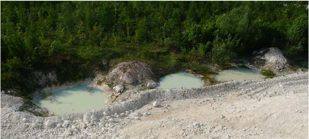
Abb. 5: Typische flache Kleingewässer im Bereich des Kieselerde-Abbaus: Wassersammelbecken am Haldenfuß. Bei hohem Wasserstand vereinigen sich die drei kleinen Becken zu einem großen.

gen brauchen dafür zwei Monate. Doch auch Unkenbiotope sollten von Zeit zu Zeit austrocknen – oder aber wieder neu entstehen. Dadurch werden Fressfeinde minimiert. Beispiele der Gewässer im Kieselerde-Abbau sind in den Abbildungen 5 bis 7 dargestellt. Um eine Vernetzung der Wasserflächen zwischen den einzelnen Tagebauen zu erreichen und damit auch einen Austausch zwischen den einzelnen Populationen zu fördern, wurden entlang der Fahrwege kleine Senken angelegt. Sie dienen den Amphibien als Wanderkorridor (Abbildung 4).