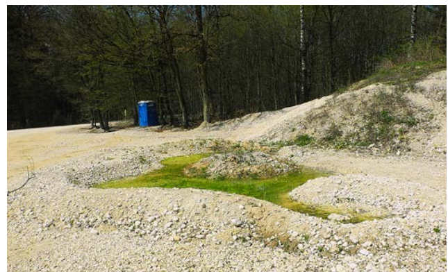
Abb. 7: Gezielt angelegte Kleinstwasserfläche auf einem Lagerplatz. Bei der Anlage wurde bewusst eine vollbesonnte Stelle gewählt. In Kombination mit der geringen Wassertiefe war besonders wichtig, Untiefen zu vermeiden, die bei Niedrigwasserstand Fallen für Kaulquappen darstellen. Damit der Tümpel nicht befahren wird, wurde ein kleiner Wall außen herum aufgeschüttet.

Fig. 6: Typical Yellow Bellied Toad habitat: ruts from dump trucks filled with rain water (SCHAILE 2014). The development of such small water bodies in undesired locations is prevented, to minimize the loss of individuals.