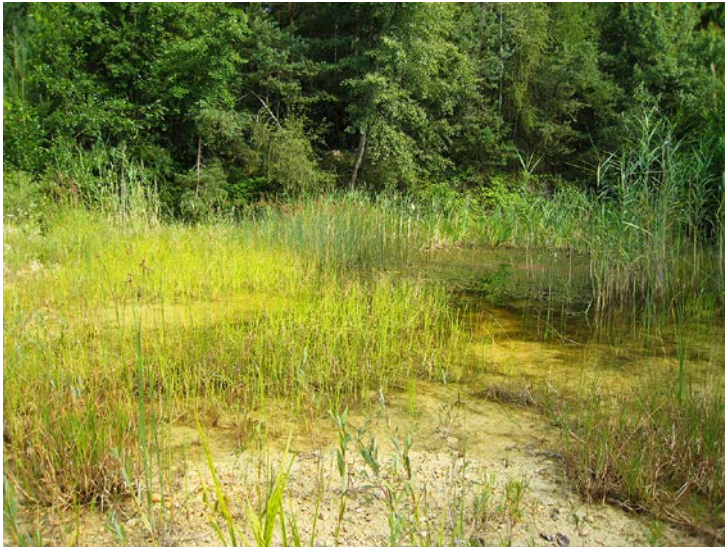
Abb. 8: Das Biotop entstand aus dem ehemaligen Wassersammelbecken des Tagebaus Hütting III und wurde 2001 als Lebensraumtyp der FFH-Richtlinie (Zielart: Gelbbauchunke) nach Brüssel gemeldet. Erst später stellte sich heraus, dass dort auch die FFH-Art Kammmolch ( Triturus cristatus ) vorkommt. Die notwendige Biotop-Pflege wird entsprechend dem FFH-Managementplan von der örtlichen BUND Naturschutz-Gruppe organisiert.

Fig. 8: The biotope was created from the former water collection basin of the opencast mining pit Hütting III. It was reported as a habitat according to the natura 2000 guidelines to Brussels in 2001 (target species: Yellow-Bellied Toad). Only later was the Great Crested Newt ( Triturus cristatus ) documented, another species addressed by the guidelines. The necessary preservation activities for the biotope, as described in the management plan, are organized by the local nature protection group.