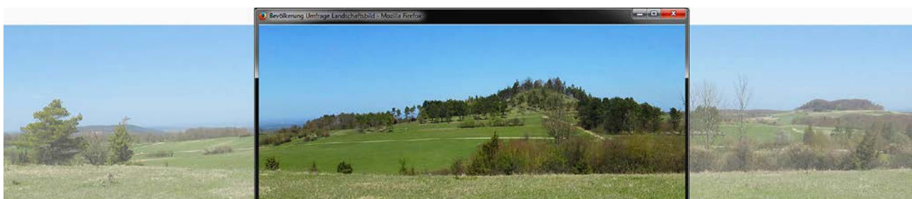
Abb. 3: Die interaktive Panoramatechnik erlaubt eine Simulation mit interaktiver Auswahl des betrachteten Landschaftsausschnittes innerhalb eines 360°-Panoramas.

3D-Strukturen und -Elemente wie Bauwerke lassen sich mit entsprechender 3D-Modelling-Software erstellen.