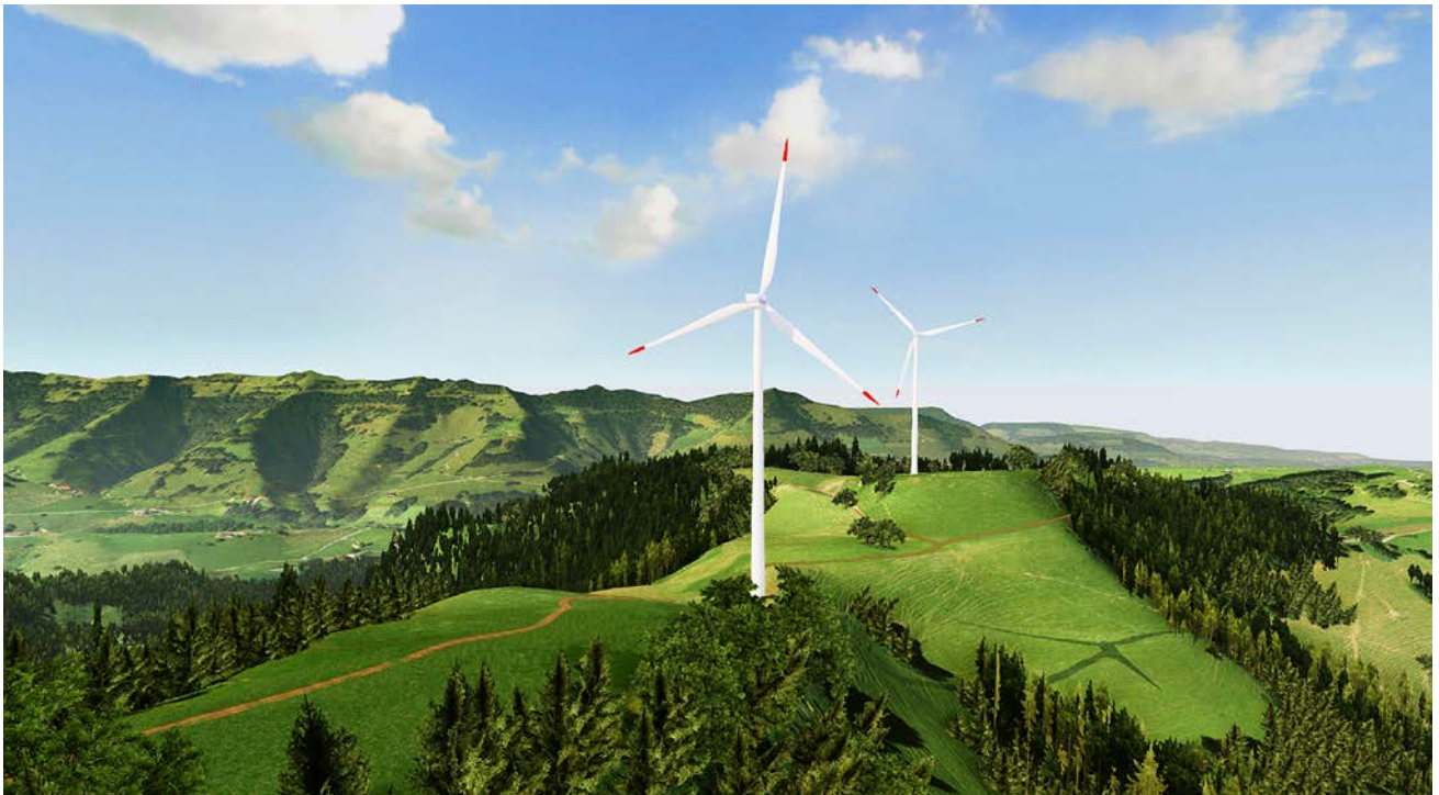
Abb. 7: Visuell-akustische 3D-Simulation von Windturbinen im Landschaftskontext eines Hügellandes, entwickelt im Rahmen des Projektes VisAsim 2014 mit der CryEngine.