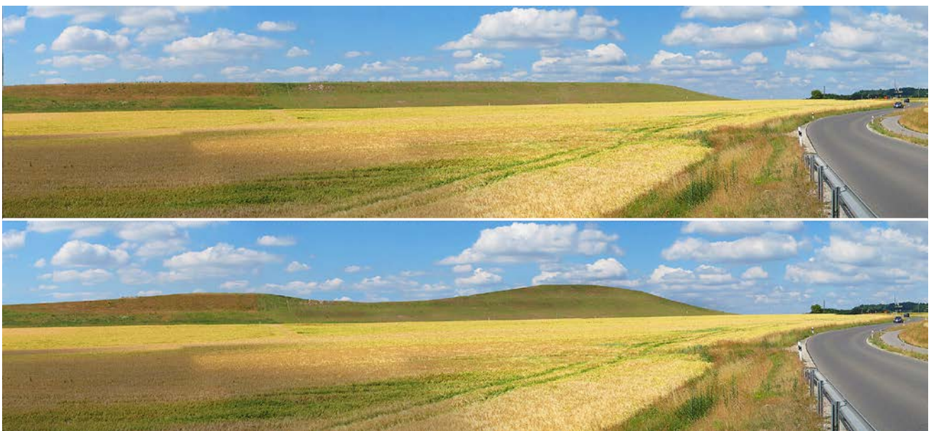
Abb. 1: Für manche Zielsetzungen sind einfache Fotoretuschen eines gestalterischen Konzeptes ausreichend. Für die Visualisierung des Abraums eines Straßenbau-Projektes beispielsweise kann so eine an die umgebende Hügellandschaft angeglichenere, natürlicher aussehende Variante geprüft werden (alle nicht gekennzeichneten Graphiken: © www.erlebnis-natur-projekte ).

Ein zentraler Aspekt, den es bei der Erstellung entsprechender Simulationen zu berücksichtigen gilt, ist ihre Glaubwürdigkeit. Zukunftsszenarien sind fiktiv und können immer nur eine Annäherung an die Realität sein, wichtig ist jedoch ihre Plausibilität. Misstrauen bezüglich der Objektivität der Darstellungen können das Vertrauen der Beteiligten gegenüber der Planung beeinträchtigen (DEMUTH & FÜNKNER 2000). So sind beispielsweise Größenverhältnisse, Standortwahl, Perspektiven und Lichtstimmungen Manipulationsmöglichkeiten, die die Botschaft eines Szenarios stark beeinflussen und lenken können. Je nach Planungsziel und -anspruch sind daher Transparenz der Visualisierungsmethode sowie wissenschaftliche Fundiertheit, Seriosität und Objektivität ihrer Durchführung unerlässlich.