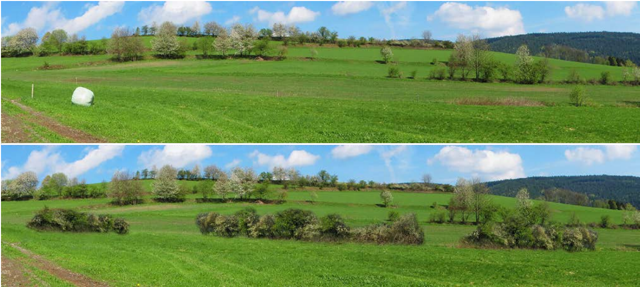
Abb. 2: Fotomontage zur Bewertung landschaftsästhetisch und ökologisch wirksamer Strukturen. Oben Originallandschaft, unten Visualisierung einer Strukturbereicherung durch Hecken.

Fig. 2: Photo montage used for the evaluation of structures that are aesthetically and ecologically effective within the landscape. Original landscape above; a visualization of landscape structure enriched with hedges below.