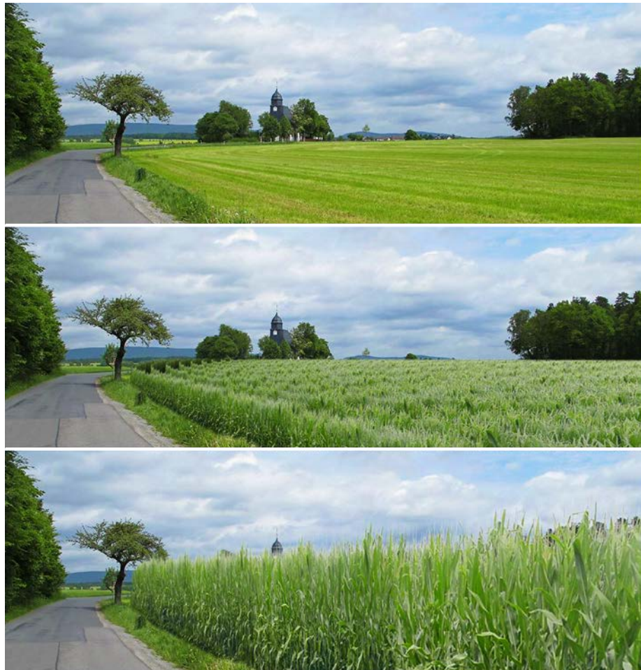
Abb. 5: 3D-Vegetationsdarstellungen in Kombination mit Landschaftsfotografie. Beispiel einer Visualisierung der Störung von Sichtbeziehungen durch hochwachsende Kulturen wie Mais (oder Kurzumtriebsplantagen).

Visualisierungsinstrumente, die allen Ansprüchen an Präzision, Detailreichtum, Realitätsnähe und Effizienz genügen, sind derzeit noch nicht am Markt verfügbar. Je nach Zielsetzung ist abzuwägen, ob der meist aufwendige Einsatz von 3D-Visualisierungen notwendig ist (DEMUTH & FÜNKNER 2000). Oft können mit einfacheren Darstellungsweisen ähnliche Ergebnisse erzielt werden. Dabei sind Budget, Zielgruppe, Darstellungsinhalt und Anspruch an Präzision und Realitätsnähe ausschlaggebend für die Wahl der Technologie.