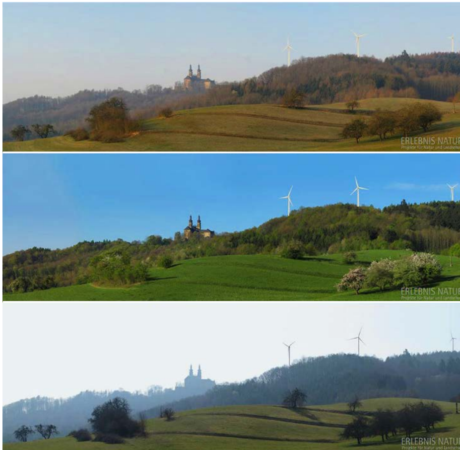
Abb. 4: Beispiel für eine virtuelle 3D-Konstruktion von Windkraftträdern in Kombination mit Landschaftsfotografie zur Analyse der Fernwirkung von Windrädern je nach Tageszeit der Aufnahme. Die Windräder wurden animiert und simulieren so die Wahrnehmung der Anlagen durch den Betrachter realistischer.

Fig. 4: Example of a virtual 3D-construction of wind turbines combined with photographs of the landscape in order to analyze the long-range effects of these wind turbines based on the time of the photo taken. The turbines were animated and, thus, simulate the performance of the equipment for the viewer more realistically.