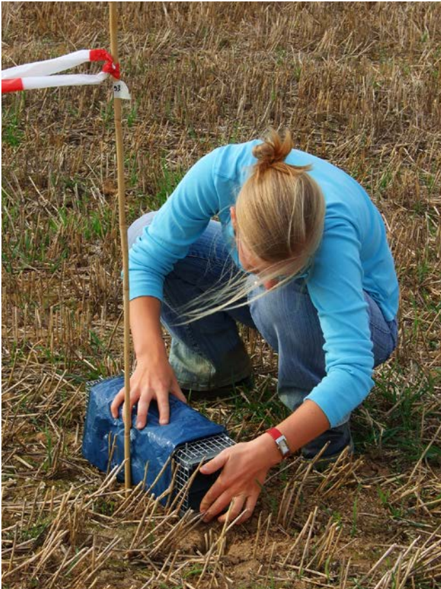
Der Feldhamster-Bestand geht in Deutschland durch die intensive Landwirtschaft weiterhin zurück. Bei Eingriffen bleibt als allerletztes Mittel nur, mit Lebendfallen Hamster umzusiedeln.

richtet die Bestandsentwicklung derzeit lediglich in Sachsen-Anhalt und in Rheinland-Pfalz, was aber übersetzt bedeutet, dass ohne wirksame Schutzmaßnahmen der Feldhamster in Rheinland-Pfalz auch in etwa zehn Jahren ausgestorben sein wird.