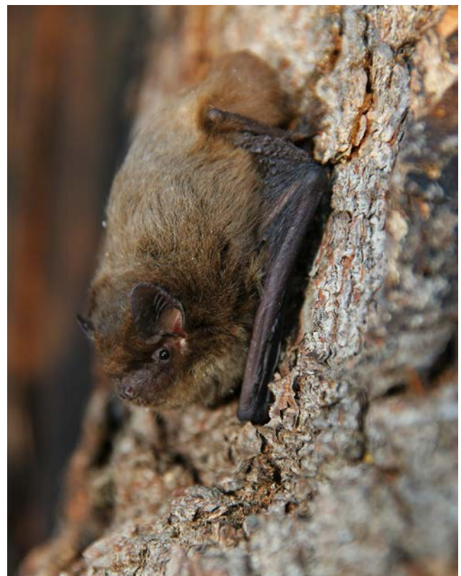
Einige Fledermausarten ziehen wie Vögel in weit entfernte Winterquartiere und sind hierbei genauso durch Windenergieanlagen gefährdet. Relativ oft sind Raufhautfledermäuse unter den Kollisionsopfern.

ZAHN, A., LUSTIG, A. & HAMMER, M. (2014): Potenzielle Auswirkungen von Windenergieanlagen auf Fledermauspopulationen. – ANLiegen Natur 36(1): 21–35, Laufen; www.anl.bayern.de/publikationen/anliegen/doc/an36106zahn_et_al_2014_windenergieanlagen_und_fledermaeuse.pdf .