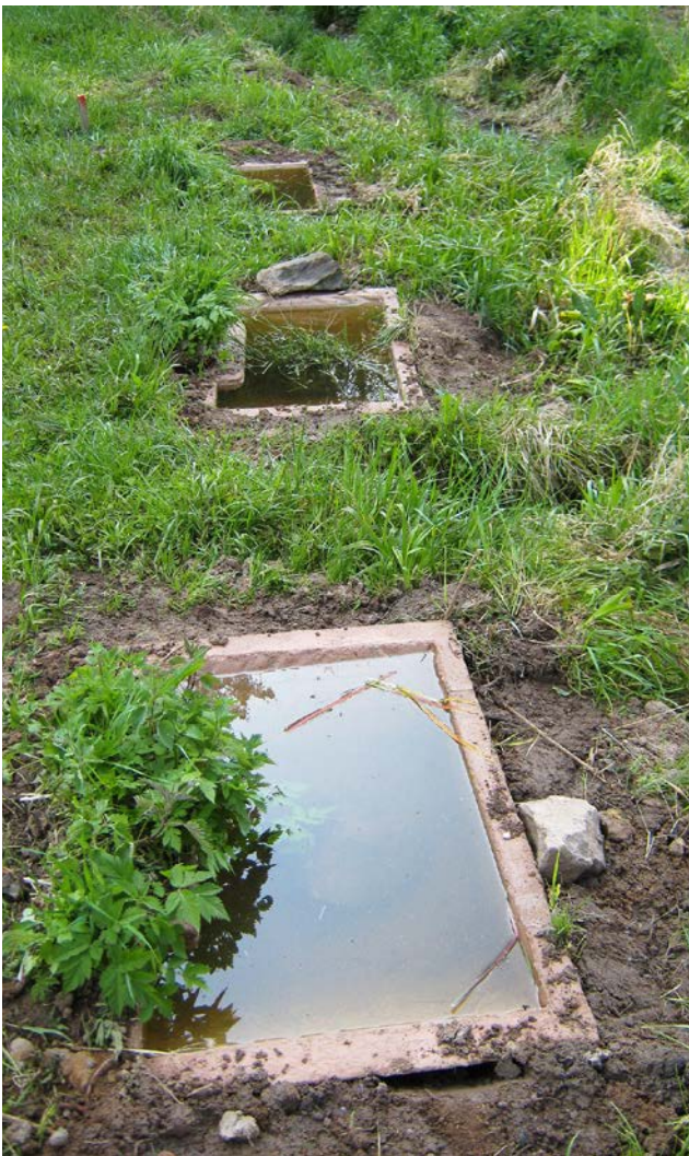
Künstliche Reproduktionsgewässer können helfen, kleine Bestände der Gelbbauchunke zu sichern.

(Markus Kurz, AZ) Wenn es nicht möglich ist, natürliche oder naturnahe Gewässer für die Gelbbauchunke zu erhalten oder zu schaffen, bieten sich künstliche Kleingewässer zur Bestandssicherung an. Eingegrabene, aus Beton gegossene Becken erwiesen sich als geeignete Reproduktionsgewässer für die Gelbbauchunke.