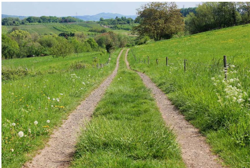
Arten- und blütenreiche Säume sind selten geworden. Ein Praxisleitfaden beschreibt, wie artenreiche Säume erhalten oder angelegt werden können.

Um in ausgeräumten Landschaften mit stark eingeschränkten Einwanderungsmöglichkeiten artenreiche Feldraine mit entsprechenden Zielarten wiederherzustellen wird empfohlen, Flächen aktiv über Einsaaten wiederherzustellen. Grundlage für eine erfolgreiche Etablierung der angesäten Arten ist eine gründliche Zerstörung der artenarmen Grasnarbe vor Einsaat, wobei neu angelegte Säume und Feldraine eine Mindestbreite von 3 m aufweisen sollten. Dabei legen die Wissenschaftler großen Wert darauf, dass nur standortheimisches Ansaatmaterial zum Einsatz kommen darf. Konkurrenzkräftige Gräser sollten in der Ansaat-Mischung durch wenig wüchsige Gräser ersetzt werden, um die Ansiedelung beziehungsweise (Wieder-)Ausbreitung unerwünschter Grasarten (wie der Quecke) zu behindern. Der günstigste Zeitpunkt für eine Ansaat ist der Spätsommer, vorzugsweise unmittelbar vor feuchten Witterungsphasen.