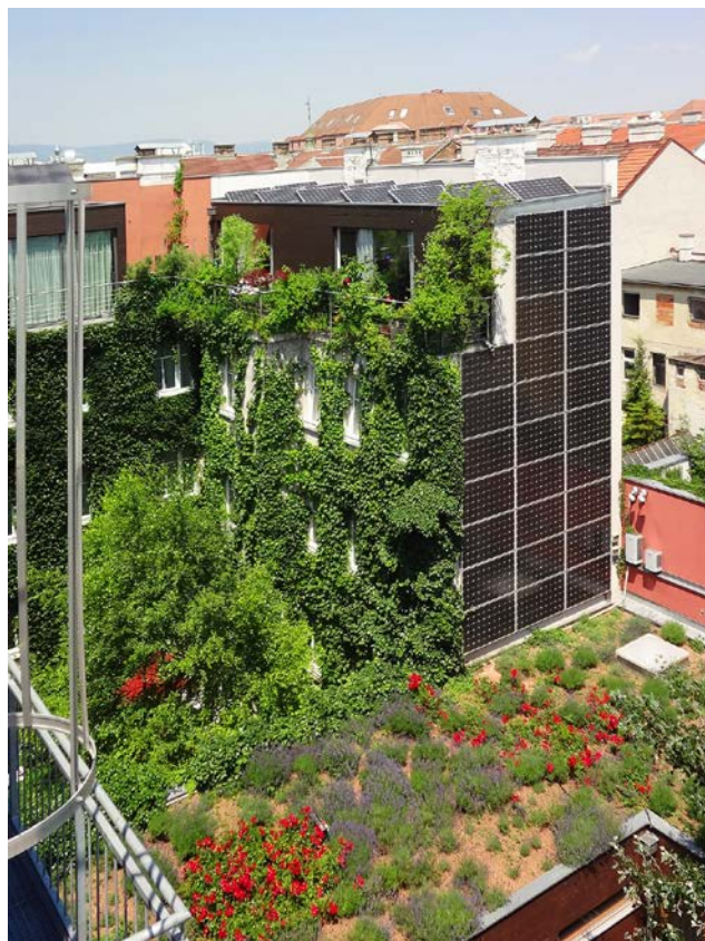
Beispiel für eine kombinierte Fassaden-, Dach- und Hofbegrünung: Das Boutiquehotel Stadthalle in Wien.

In den Zeiten des globalen Klimawandels rückt zudem in den Vordergrund, wie die Versorgung durch erneuerbare Energien gelingen kann. Eine Kombination einer Photovoltaik-Anlage mit Begrünung bietet sich als eine optimale Lösung für Ballungsräume an. Dabei erhöht die inzwischen direkt hinter den Photovoltaik-Modulen angebrachte Begrünung den Stromertrag, indem sie die Module kühlt. Dies liefert zweifellos