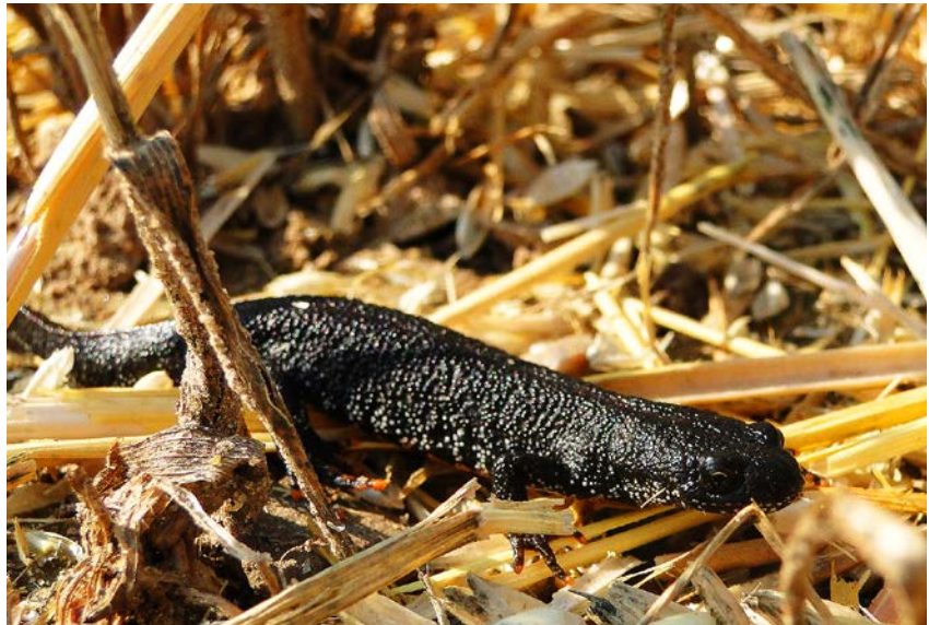
Beim Schutz von Amphibien spielen leicht nachvollziehbar die Fortpflanzungsgewässer eine große Rolle. Allerdings muss auch die Landphase intensiv betrachtet werden, in der Amphibien (wie der Kammolch, Triturus cristatus ) beispielsweise Pestiziden aus der Landwirtschaft ausgesetzt sind.

Bei Schutzmaßnahmen für Amphibien sind zumeist die Laichgewässer im Fokus, die zwar eine essentielle Lebensraumkomponente darstellen, aber letztendlich „nur“ den gleichen Stellenwert haben, wie die Landlebensräume. Gerade die Landlebensräume und Wanderkorridore sind oft schwer abzugrenzen und durch eine Vielzahl unterschiedlicher Nutzungen gekennzeichnet, oft auch durch Flächen konventioneller Landwirtschaft mit Pestizideinsatz. Gerade bei der Wanderung der Amphibien zu den Laichplätzen durchqueren diese oft auch landwirtschaftlich genutzte Anbauflächen, in denen zeitgleich Pestizide ausgebracht werden. Wissenschaftler der Universität Koblenz-Landau und des Leibniz-Zentrums für Agrarlandforschung veröffentlichten dazu aktuell eine Studie, welche die Effekte der landwirtschaftlichen Praxis auf Amphibien untersucht. Beobachtet wurden vier Arten der europäischen FFH-Richtlinie: Moorfrosch/ Rana arvalis , Knoblauchkröte/ Pelobates fuscus (beide Anhang IV) sowie Rotbauchunke/ Bombina orientalis und Kammolch/ Triturus cristatus (beide in den Anhängen II und IV genannt). Die Forscher fanden heraus, dass die Pestizid-Belastung von Amphibien insbesondere vom Zeitpunkt der Laichwanderung abhängt. Spät wandernde Arten, wie Unken und die Knoblauchkröte, sind stärker durch Pestizide gefährdet als früh wandernde Arten wie der Moorfrosch. In der Untersuchung waren beispielhaft bis zu 86 % einer Knoblauchkröten-Population von