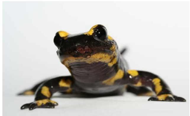
Zahlreiche europäische Salamander (hier Feuersalamander) und Molche sind durch einen aggressiven, eingeschleppten Pilz bedroht.

BÄUMLER, Z. & KURZ, M. (2015): Künstliche Laichplätze für die Gelbbauchunke als Mittel für die Bestandsstützung. – Feldherpetologisches Magazin 3: 22–26.