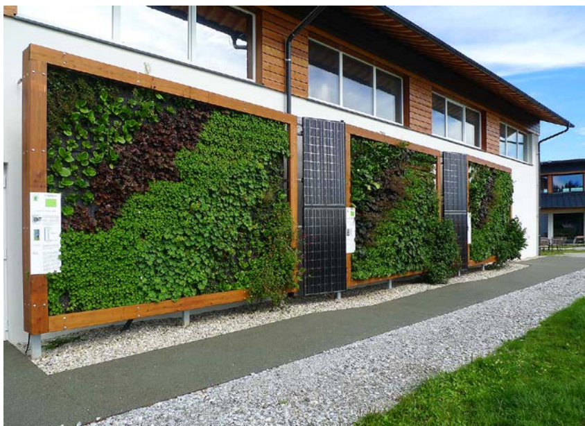
Im „GrünAktivHaus“-Projekt, untersuchen die TU Wien, BOKU und 16 Unternehmen an drei verschiedenen Fassadensystemen, wie sich Photovoltaik und Fassadenbegrünung kombinieren lassen.

Die weltweiten Prognosen sagen voraus, dass im Jahr 2050 zwei Drittel aller Menschen in Städten leben werden. Damit die Lebensqualität in den Städten der Zukunft erhalten bleiben kann, braucht man multifunktionale Systemlösungen, mit denen man Heiz- und Kühlenergie sparen, Staub binden, Luftqualität erhöhen und Lärm mindern kann. Außerdem muss Problemen wie Hitzeinseln, CO 2 -Bindung und Überschwemmungen entgegengewirkt werden. Als eine innovative Lösung dafür bietet sich die Begrünung des städtischen Raums an, die in den letzten Jahren ein immer beliebteres Werkzeug für Architekten und Planer geworden ist. Begrünte Fassaden haben, neben der optischen Erscheinung und der sozialen Anerkennung von Natur in Ballungsgebieten, auch positive Einflüsse auf die bauphysikalischen Eigenschaften der zugrundeliegenden Objekte. Es werden zurzeit viele unterschiedliche Fassadenbegrünungssysteme eingesetzt, die alle unterschiedliche Wirkungsweisen auf das Gebäude und deren Umgebung haben.